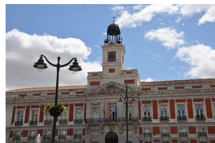
プエルタ・デル・ソル広場のクロックタワー

大晦日の夜、スペイン人は12粒のブドウを準備して、家のテレビでマドリードのプエルタ・デル・ソル広場のクロックタワーの生放送を見るか、私の地域のクロックタワーの前に立ってブドウを食べます。ただし、私の地域のカナリア諸島だけが、スペイン本土と1時間の時差があるため、私は毎年マドリードの生放送を見てから後1時間待たないといけませんでした。本土に住んでいる友達に「明けましておめでとう」のメッセージを送って、1時間後のカナリア諸島テレビでのクロックタワーの生放送を待っていました。