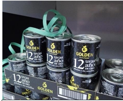
年越し用の缶ブドウ

とにかく、12月31日の24時になればいよいよ新年を迎える瞬間です。家で年越しをするスペイン人は、前もってブドウを準備して、鐘の音を聞き逃さないようにすごく集中します（実際の大きな12回の鐘の音の前に、それを告げるための小さな鐘が鳴りますので、間違えないように集中しないとけません）。クロックタワーの鐘が12回鳴ります。各鐘の音に合わせてブドウを1粒ずつ食べます。そして、12粒を食べ切ったら、やっと無事に新年を迎えられたと言えます。31日の夜、家族や愛する人に囲まれて12粒のブドウを食べ切れたらクラッカーを鳴らしたり、カバ（カタルーニャ州産のスパークリングワイン）で乾杯をしたり、愛しい人にハグや両頬にキスをしたりします。