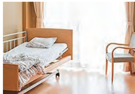
[福祉用具レンタル]

1. 安心した地域生活、2. 自立した生活のサポート、3. 地域に根差した連携の3つのミッションを掲げ、5つの主要事業を通して安心と喜びを提供し、さまざまなニーズにお応えしています。