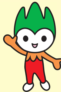
やまぐちけん ほんぶちょう 山口県PR本部長 ちよるる