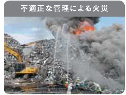
不適正な管理による火災

廃家電は電池やプラスチックを含むため、発火・延焼の危険性があり、不適正な管理による火災が発生しています。