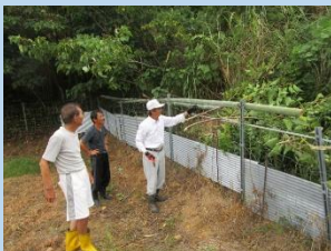
既存侵入防止柵の点検