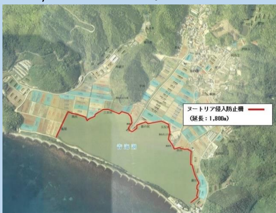
ヌートリア侵入防止柵設置位置