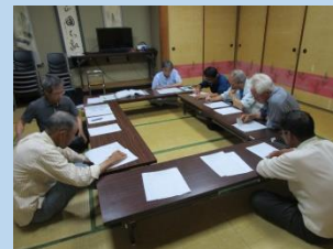
集会での聞き取り