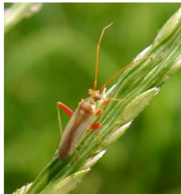
写真2 アカスジカスミカメ成虫 (体長 4.6～6mm)