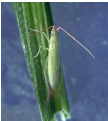
写真3 アカヒゲホソミドリカスミカメ成虫 (体長 5～6mm)