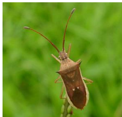
写真4 ホソハリカメムシ成虫 (体長 9～11mm)