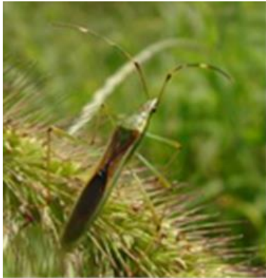
写真1 クモヘリカメムシ成虫 (体長 15～17mm)