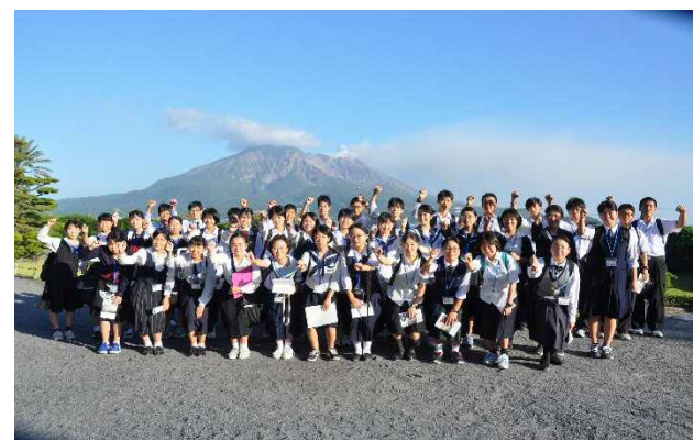
桜島をバックに集合写真