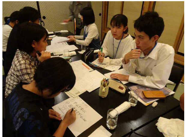
翌日の発表会に向けプレゼン資料作成