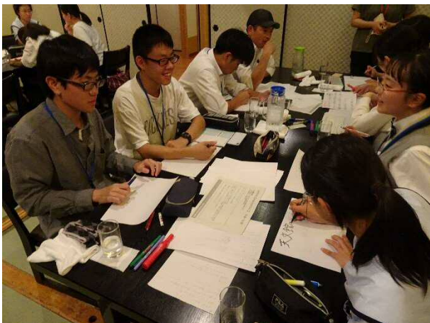
翌日のプレゼンに向け資料作成