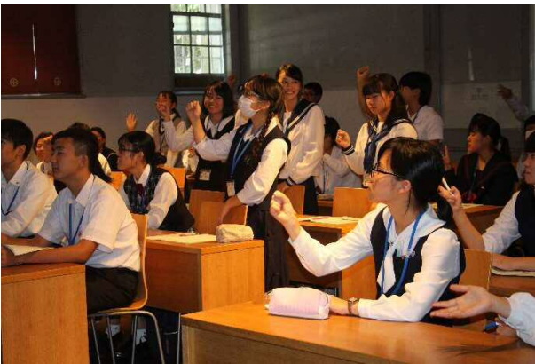
鹿児島県の歴史をクイズを交えて学習