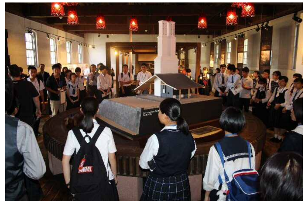
尚古集成館において集成館事業などについて学習