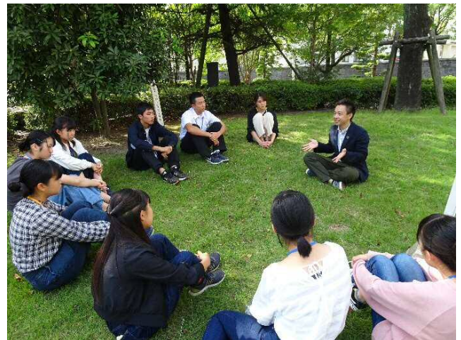
実際に、自然を目や耳や肌で感じ、自然や環境について考えるワークショップ