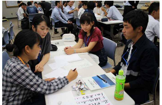
フィールドワークで見たこと、聞いたことを振り返る