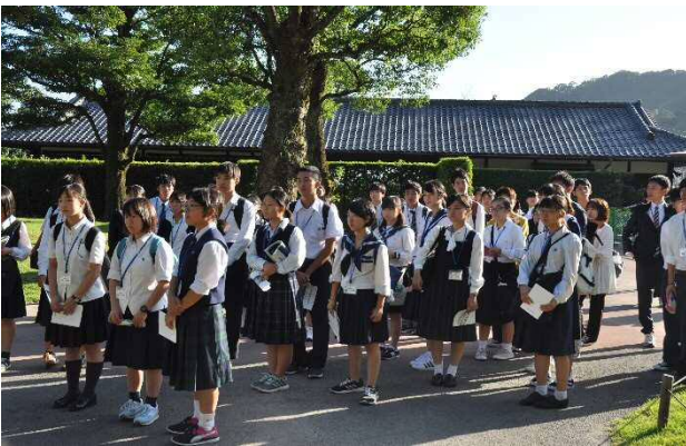
仙巖園でのフィールドワーク “変わることを恐れない”という政策方針に心打たれた生徒も多かった