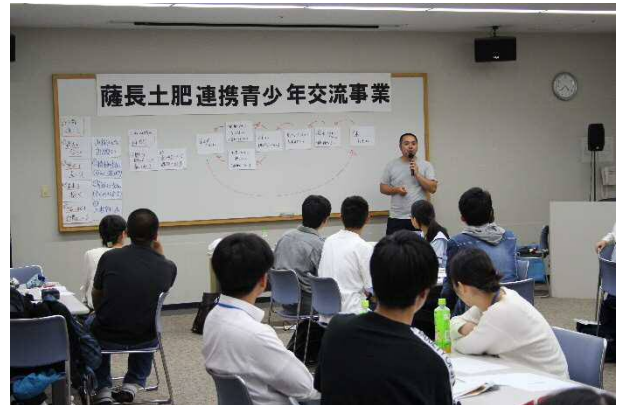
課題の整理・解決方法として「システム思考」を学習