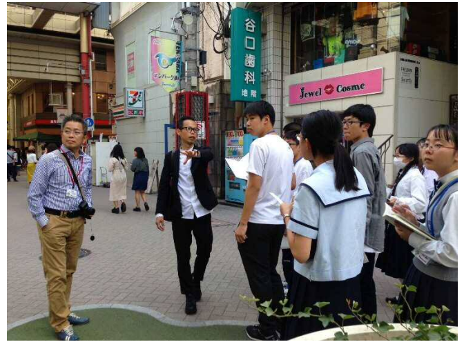
鹿児島市の中心市街地である天文館を散策