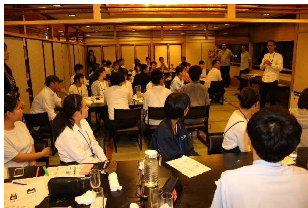
翌日の発表会に向けて各講師陣からのアドバイスとメッセージ