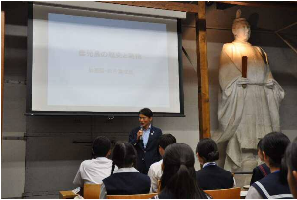
三反園知事から激励のメッセージ