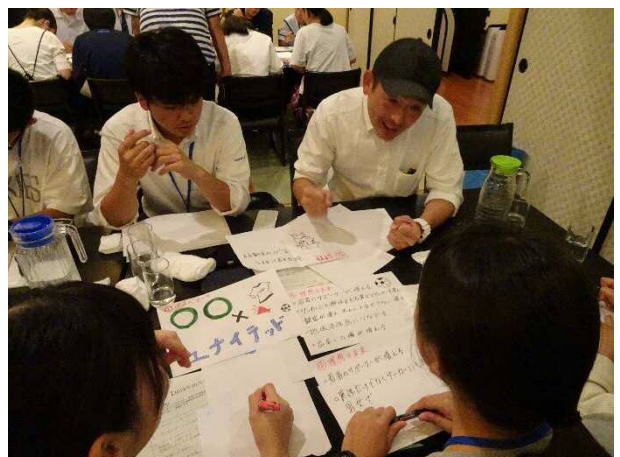
講師の先生から資料作成や効果的なプレゼンの方法について助言を仰ぐ