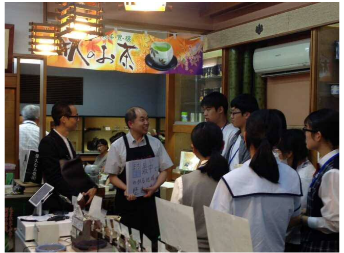
商店街の取組などについて、実際に現場を見て課題を分析