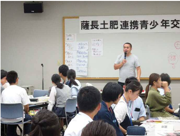
各班が集合して課題整理のワークショップ