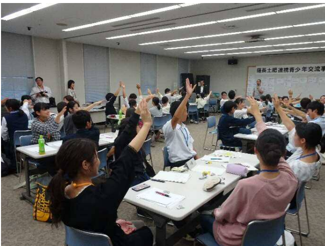
目標の到達度をチェック 手を挙げる角度で自分の到達度を表示