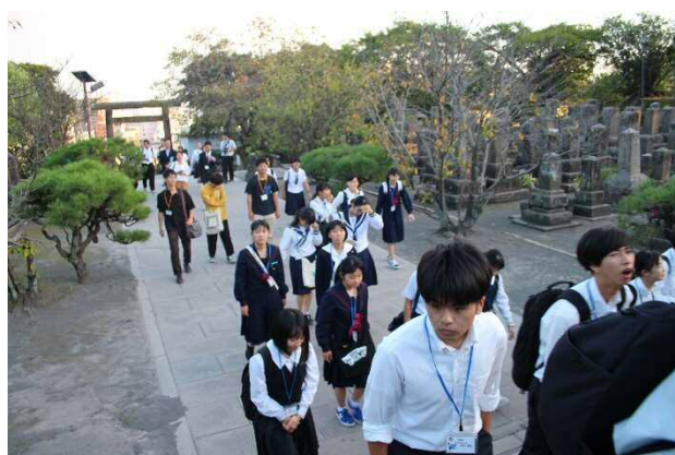
南洲墓地にて、鹿児島と山口・高知・佐賀との歴史的なつながり等についても学習