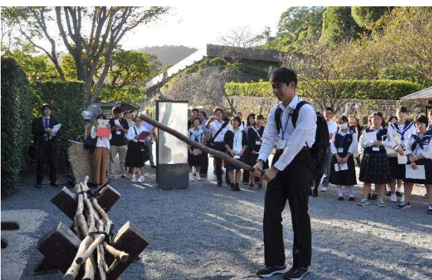
薬丸自顕流の体験