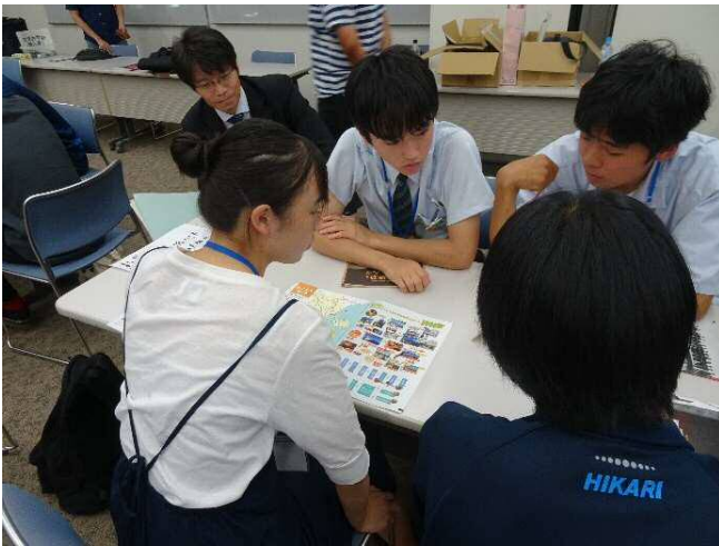
テーブルファシリテータの大学生と一緒に各自のテーマについて課題を検討