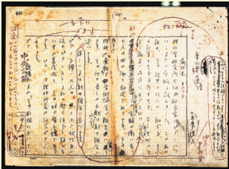
直筆原稿 (萩博物館所蔵)