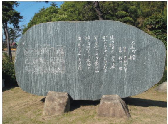
周防大島町筏八幡宮前にある「なみだ船」の歌碑。碑文は星野と船村徹による自筆。