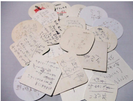
思いついた歌詞やタイトルを書きとめたコースター類。多くの作品がここから生まれた。