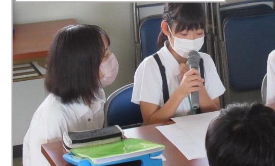
小中高が連携した教育活動

防府の文化や伝統、産業や自然などを学び、“ふるさと防府”を愛する心を育む活動を行った。