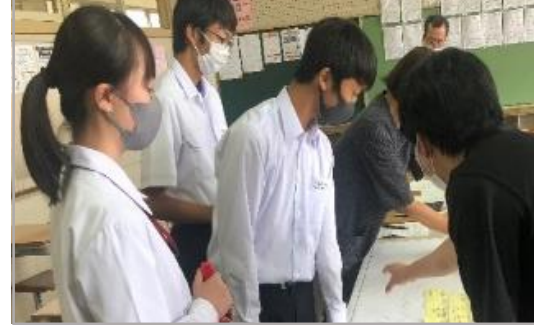
生徒を中心とした熟議

「地域の課題と今後の取組」をテーマに、「環境清掃」「防災」「交通安全」について熟議した。