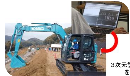
3次元設計データを通信