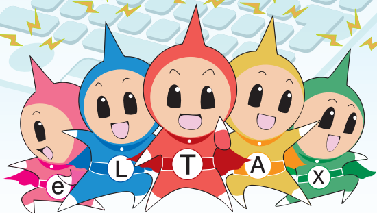
eLTAX イメージキャラクター: エルレンジャー