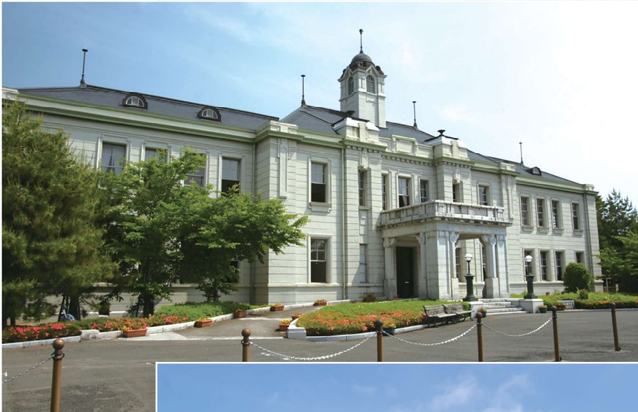
【旧県会議事堂】 (国指定重要文化財)