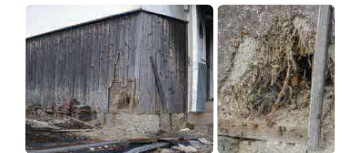
ハチの巣を狙って壊された建物

住居周辺にできたハチの巣を狙ってクマが出没することがあります。専門業者に依頼するなどしてハチの巣を除去しましょう。