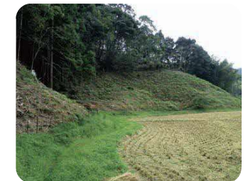
林縁の藪刈り払いの様子

※環境整備は継続することが重要になりますので、地域でよく話し合ってから実施することをお勧めします。