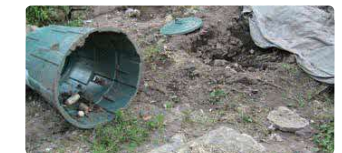
荒らされたコンポスト

生ごみを入れたコンポストはクマを誘引するため、出沒のおそれのある地域では電気柵等で対策を行うか、使用しないことをお勧めします。また、ごみ出しはできるだけ収集の直前に行いましょう。