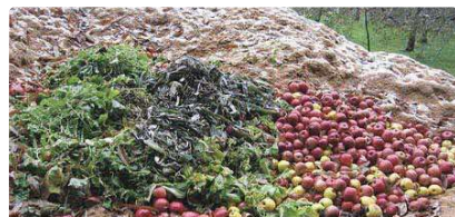
屋外に放置された果実