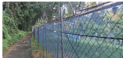
侵入防止柵の設置

果実を放置するとクマを誘引してしまいます。掘り返されないよう土中に深く埋めるか業者に回収してもらうなど適切に処理しましょう。