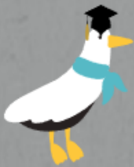
창원의 市鳥 펭귄갈매기

창원시는 창원시 마산시 진해시가 병합하여 탄생한 인구 100만명의 경상남도 최대 규모의 도시입니다.