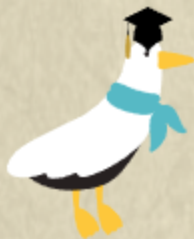
창원의 市鳥 꿩이갈매기