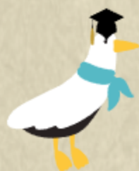
昌原市の市鳥-うみねこ