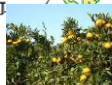
みかん畑 みかんなべ