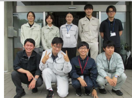
令和4年4月採用職員