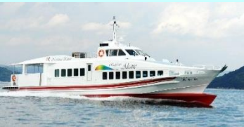
「レインボーあかね」で約30分