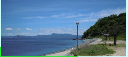
海水浴場・キャンプ場

津久美浜は、夏のシーズン中、海水浴やキャンプでにぎわいます。 キャンプ場は無料で利用できますので、夏のレジャーにお勧めです。