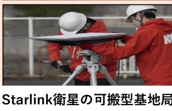
Starlink衛星の可搬型基地局