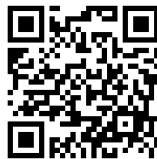
申込フォームはこちらから↑

* ご記入いただいた個人情報、本セミナーの参加申込以外には使用いたしません。また、ご本人の同意なく、第三者に開示・提供することはありません。