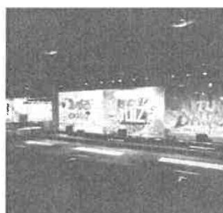
情報発信スペース