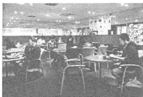
交流・コワーキングスペース