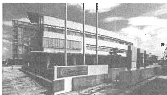
山口県産業技術センター