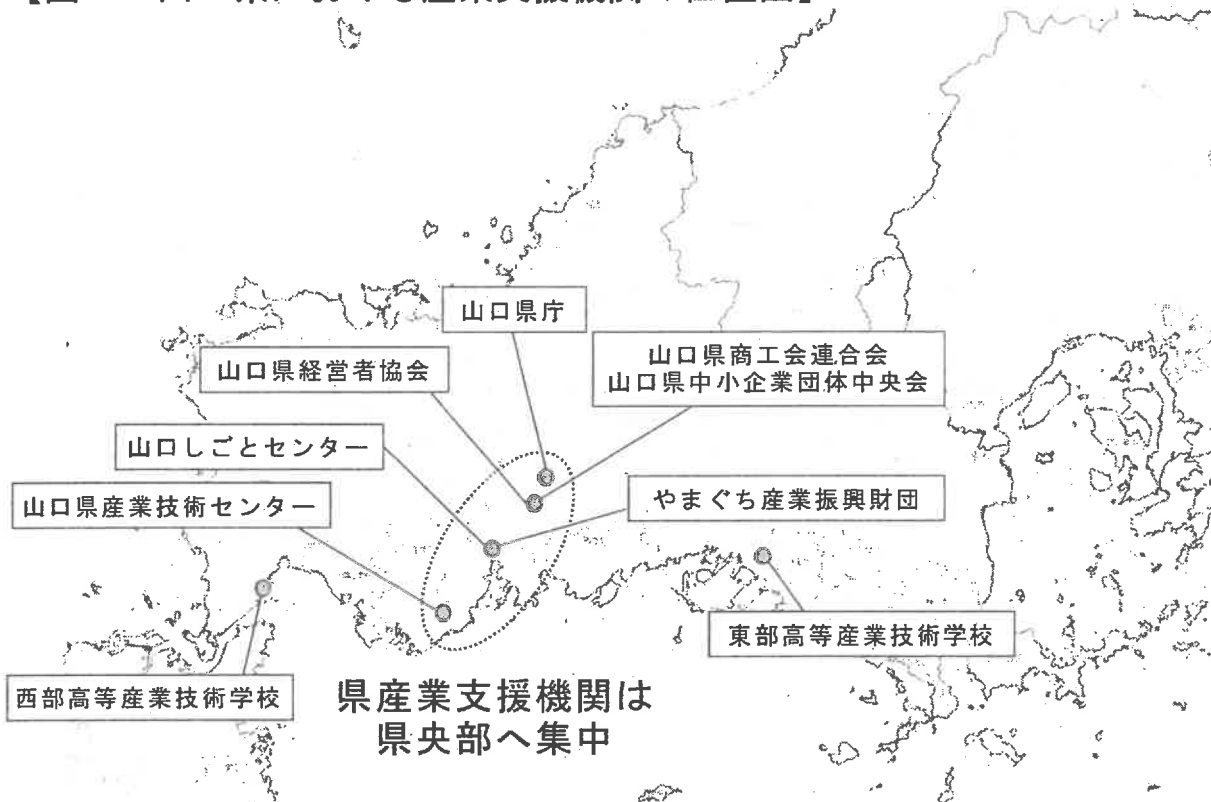
【図1：山口県における産業支援機関の位置図】