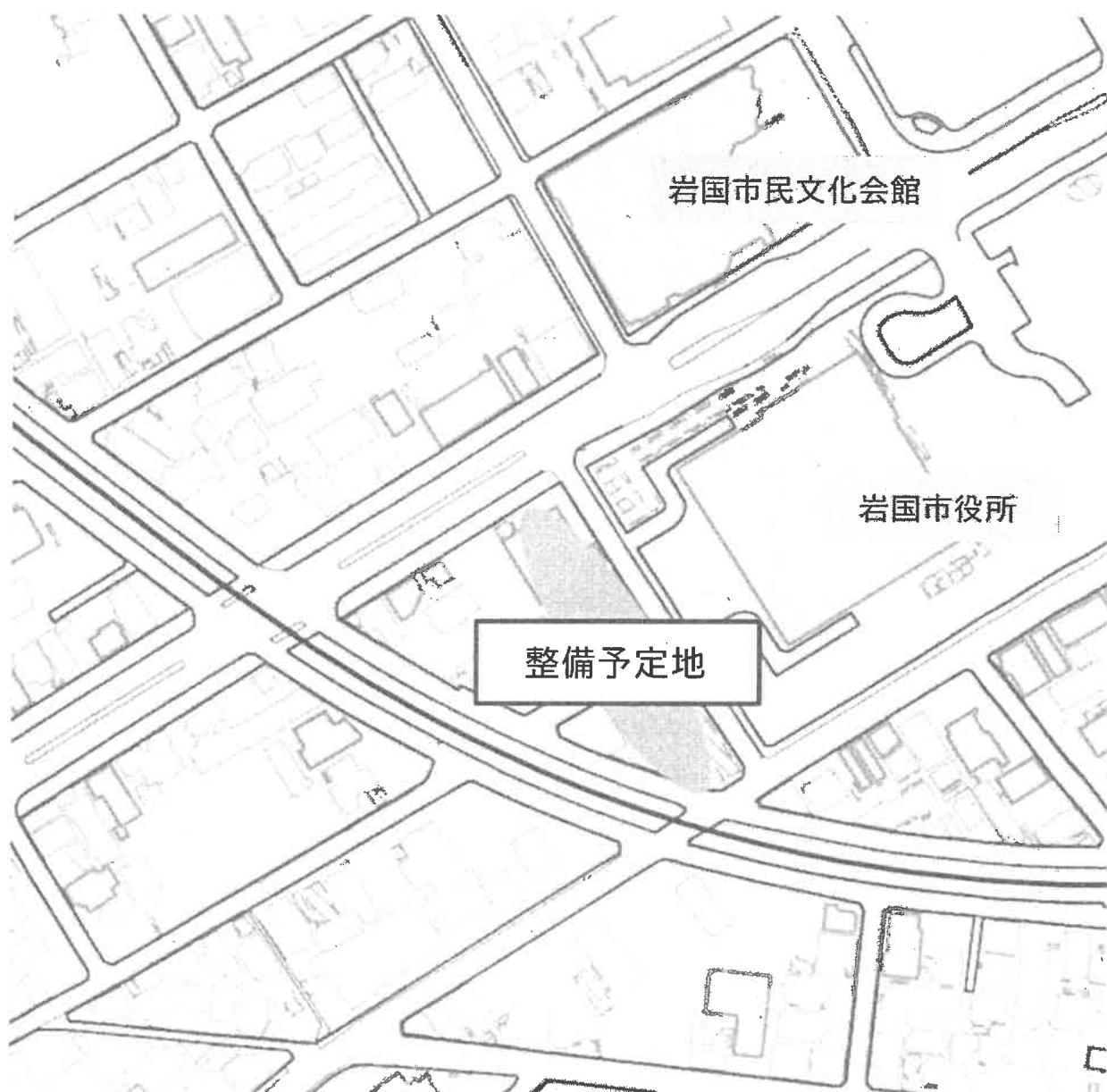
【図3：整備場所の区域図】

また、事業者等への支援をより効果的に行う観点から、岩国商工会議所との合築により整備します。