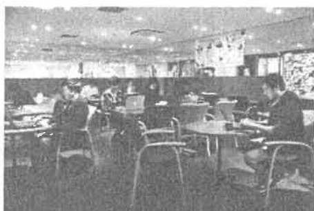
交流・コワーキングスペース