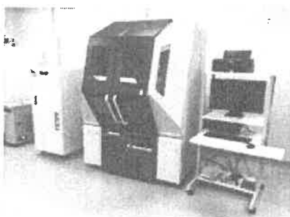
試験・計測支援室