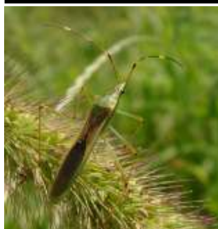
クモヘリカメムシ 体長 15-17mm