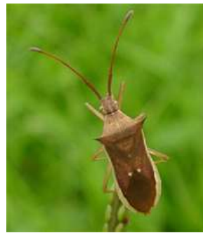
ホソハリカメムシ 体長 9-11mm