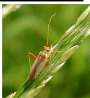
アカスジカスミカメ 体長 4.6-6mm