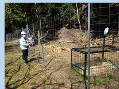
設置した侵入防止柵及び箱わな