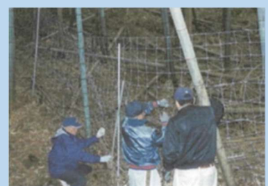
既存侵入防止柵破損箇所調査