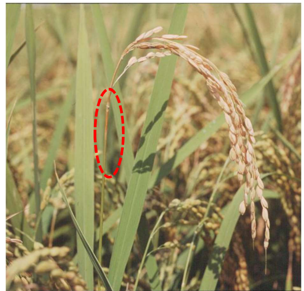
穂首いもち (穂首が褐変)