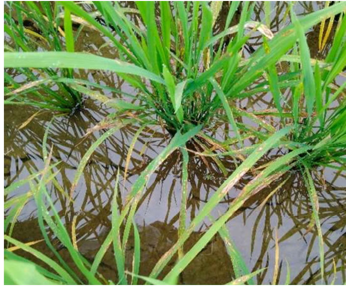
葉いもちの発生株