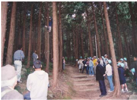
◆指導林業士による森林づくり教室 (枝打ちの実演)