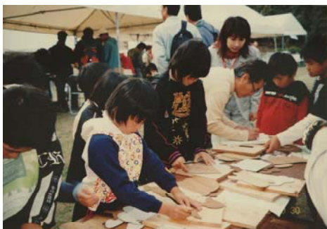
◆木エクラフト・竹細工体験工房