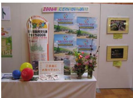
◆国民文化祭、フラワーランドのPR