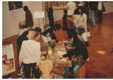
◆木のパズル等の展示コーナー