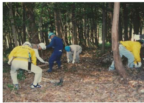
◆森林づくり活動体験