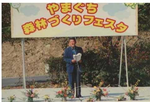
◆綿屋副知事による主催者あいさつ