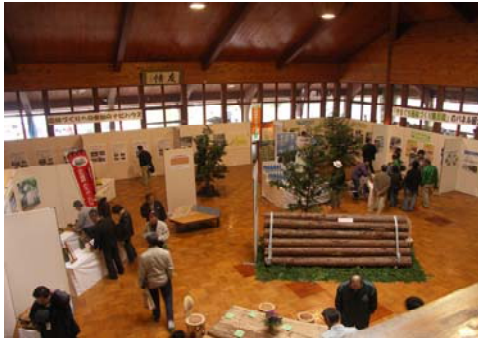
◆森林のパビリオンでの展示