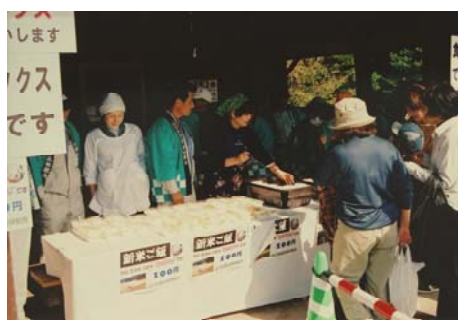
◆森林のレストラン