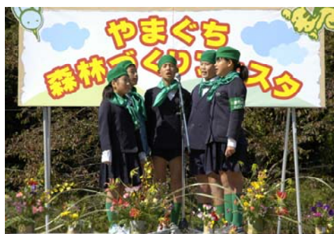
◆三豊緑の少年隊による森づくり宣言