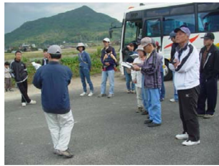
◆丸ごと「やまぐち森林づくりの日」バスツアー