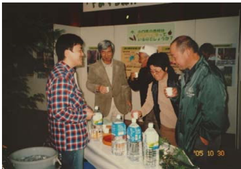
◆水の試飲コーナー