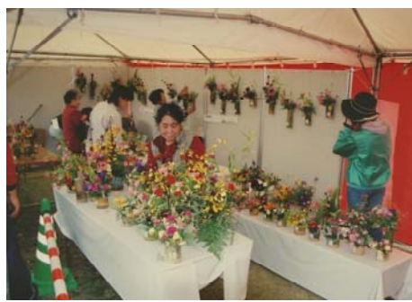
◆竹のフラワーポット等の無料配布