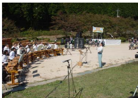
◆バンブーオーケストラの演奏