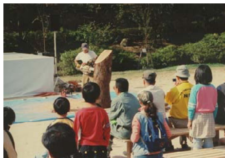
◆チェンソーアート