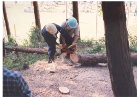
◆指導林業士による森林づくり教室 (チェーンソーの操作)