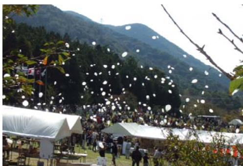
◆1000人の森林づくりメッセージ