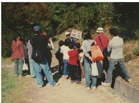
◆森林環境学習ウォーク