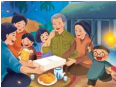
家族が集まる機会