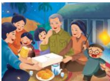
Gia đình đoàn viên

Dưới đây là một số sự kiện chính trong Tết Trung thu Việt Nam.