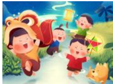
子ども向けイベント