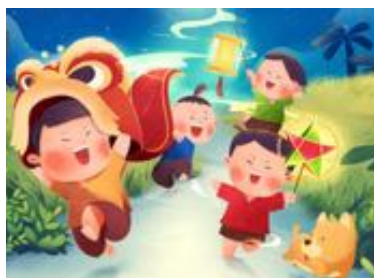
Sự kiện giành cho trẻ em