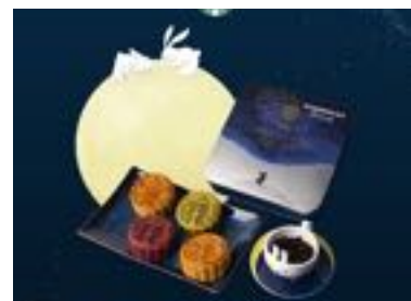
Bánh trung thu