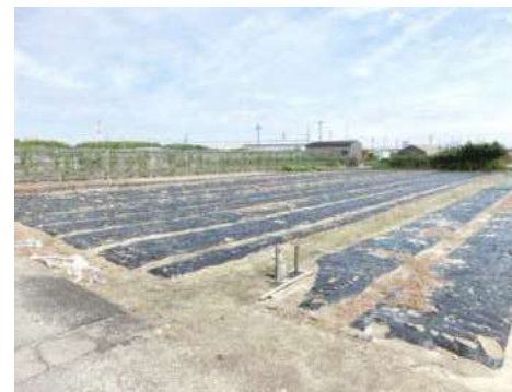
交付対象となっていた水田 (畦畔はない)