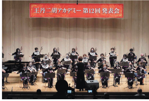
文化芸術を担う人材の活躍支援