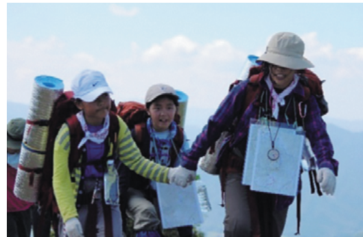
心の冒険・サマースクール