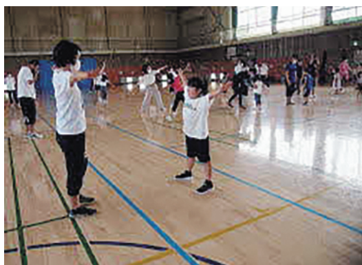
親子でのレクリエーション