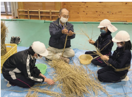
しめ縄づくりを通じた世代間交流