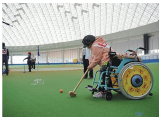
障害者スポーツ教室（グラウンド・ゴルフ）