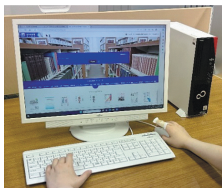
電子図書館サービス