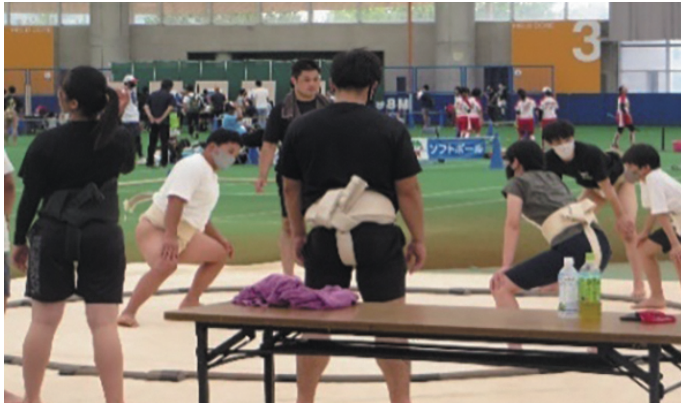
競技体験プログラム