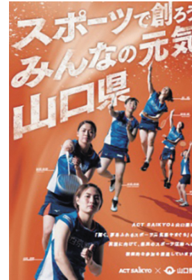
スポーツによるまちづくり