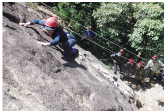
野外教育活動指導者研修会