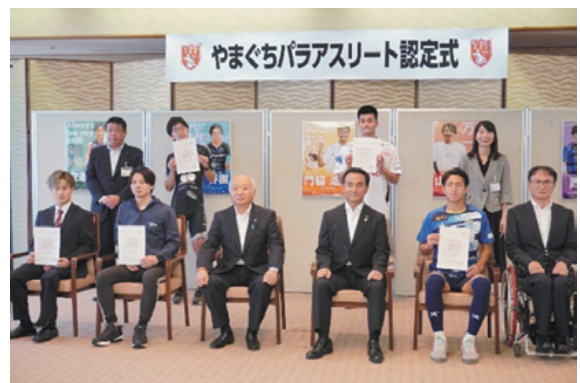
やまぐちパラアスリート認定式