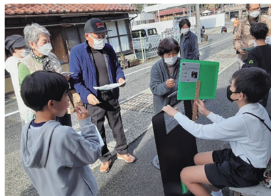
地域住民によるふるさと祭りの参加を通じた 児童の学習活動への支援