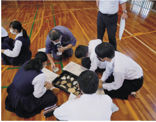
学べる文化財講座