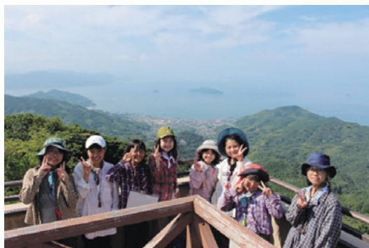
やまぐちアドベンチャーキャンプ