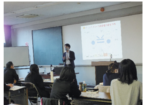
障害者スポーツ指導者講習会