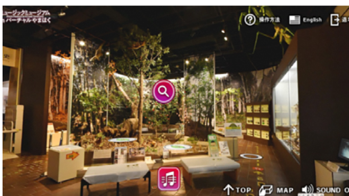
バーチャル山口博物館