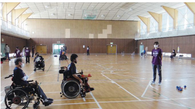
キラリンピック（山口県障害者スポーツ大会）