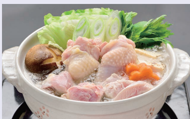
※写真は調理イメージです。