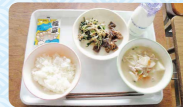
(メニュー:鯨の竜田揚げ)