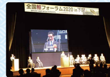
「全国鯨フォーラム2020」(令和2年11月 下関市)