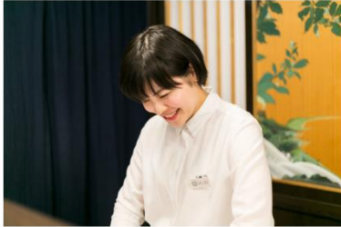
キャリア形勢の支援