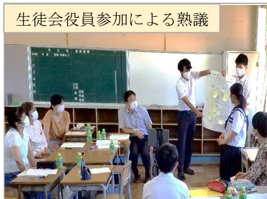
生徒会役員参加による熟議

学校運営協議会委員と生徒会執行部の生徒が「校則について」というテーマで熟議を実施した。