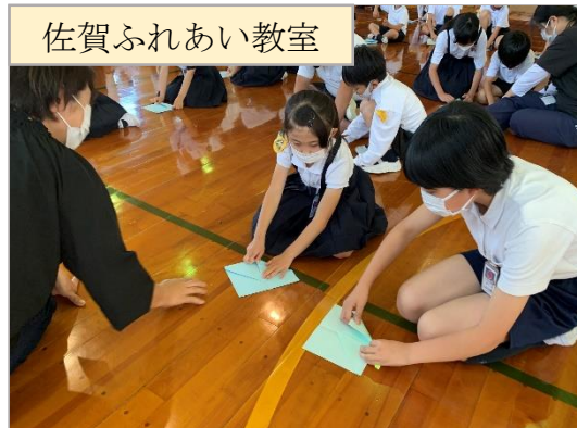
佐賀ふれあい教室

放課後子ども教室（佐賀ふれあい教室）で地域の方々と様々な遊びや体験を行っている。