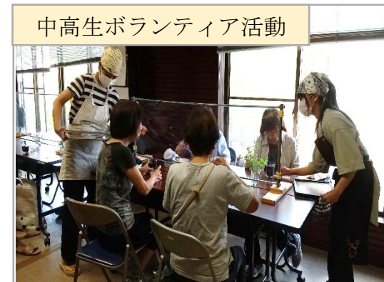
中高生ボランティア活動

地域で行われている様々な活動に中高生がボランティアとして参加し、交流を深めている。