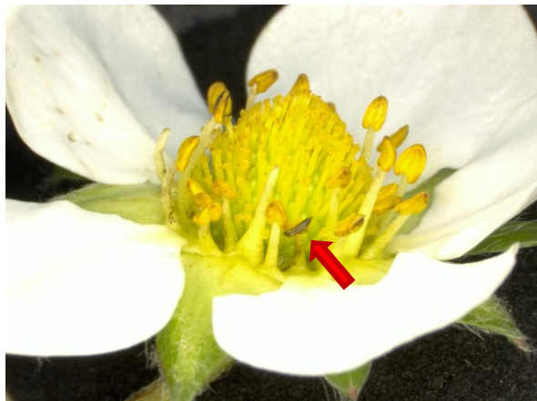
写真2 イチゴの花に寄生するヒラズハナアザミウマ