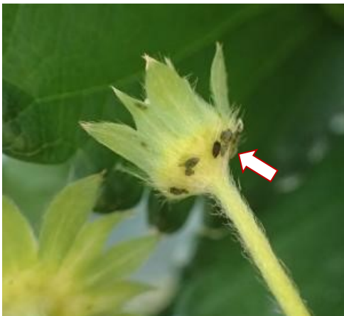
写真1 イチゴの花蕾に寄生するワタアブラムシ