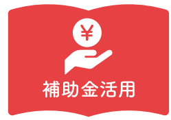
ステキ女子活躍推進補助金を活用した経営改善事例 ... P12

山口県内には自身の「ステキ・スタイル」を持ち、農林漁業を職業として活躍している女性の仲間がたくさんいます。やまぐち農林漁業ステキ女子は、「きれい」「輝き」ながら、「かしこく」「かせぐ」ステキ女子を目指して、経営発展につながるさまざまな取り組みを展開しながら、農林漁業の魅力を発信しています。