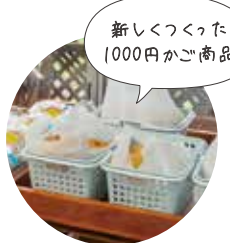
新しくつくった1000円かご商品