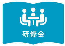
「働きやすさ」をつくる経営改善研修会 ... P10