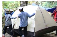
1日目 (荷物準備・テント泊)

山での活動に向けて、インストラクターの指導の下、荷物をザックに詰め込みます。初めてのテントも協力して設営しました。