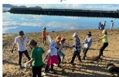
7日目 (海浜清掃・学習発表会)

川で火照った体をクールダウンしたり、ここまでの仲間や自分に思いを馳せるソロの時間を過ごしたりしました。