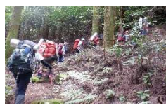
2日目 (バックパッキング)

山での活動に向けて、インストラクターの指導の下、荷物をザックに詰め込みます。初めてのテントも協力して設営しました。