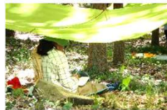
3日目 (水浴び・ソロ)

大きな荷物を背負っての本格的な山歩きがスタート。文珠堂から文珠山・嘉納山をめざします。