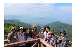
4~5日目 (ファイナルツアー)

ニホンアワサングについてお話を聞いた後、現地でシーカヤック&シュノーケリングに挑戦しました。