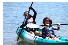
6日目 (マリンアクティビティ)

地元の方の協力も得て、海浜清掃を実施しました。また、閉会式では、班ごとに6泊7日の学びを発表し合いました。