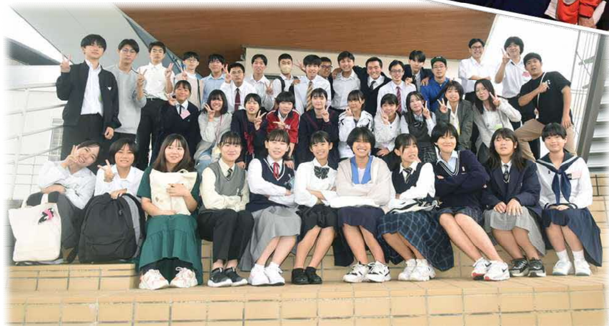
激動の時代を生き抜いた坂本龍馬からの学び