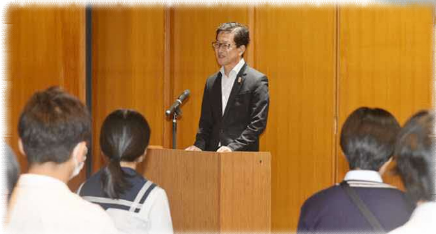
濱田高知県知事から 歓迎のご挨拶