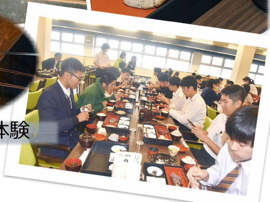
桂浜 & 鰹藁焼き体験