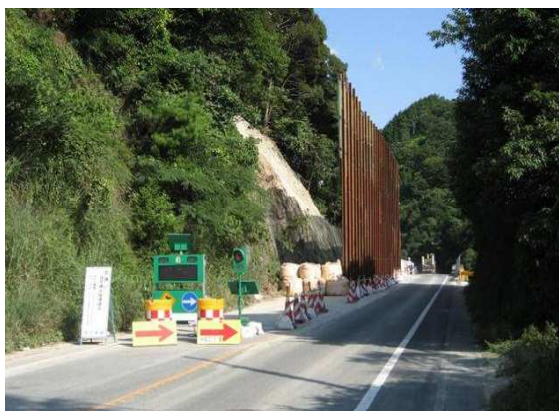
国道316号（長門市四ノ瀬）

さらに、農林関係施設については、激甚災害法のいち早い適用が決定されており、被災したため池45箇所について、二次災害防止のための緊急点検等を実施するなど、他の農地、農業用施設等と併せ、今後、災害復旧事業等により本格的な復旧工事を行います。