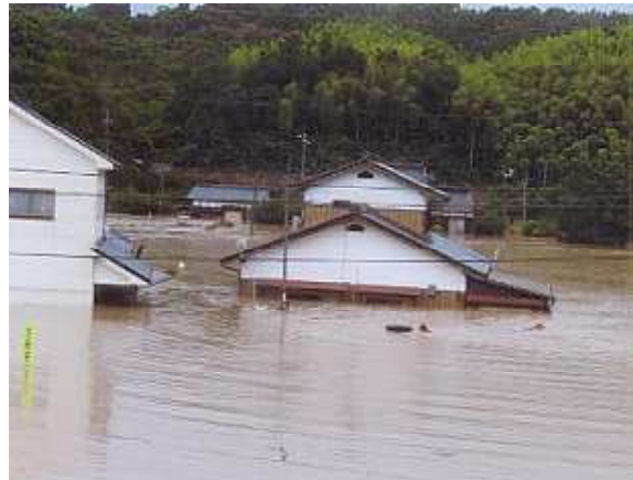
泳いで救出に向かう機動隊員 (美祢市)