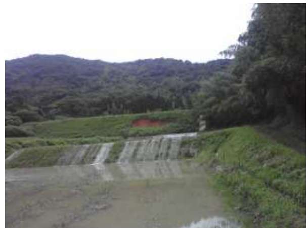
大飛田ため池被災状況（下関市豊浦町）