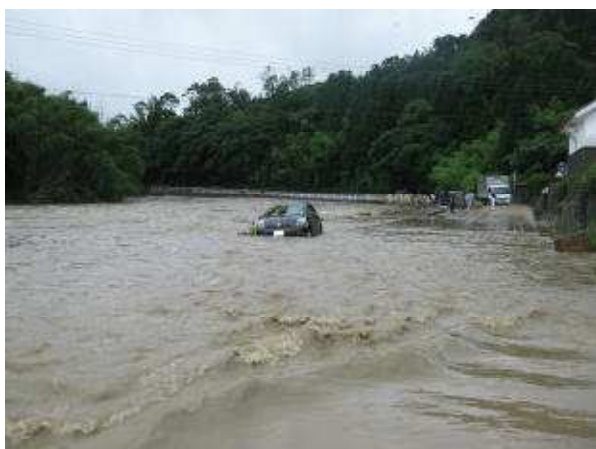
厚狭川の氾濫状況（美祢市東厚保）