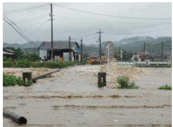
厚狭川の氾濫状況（山陽小野田市厚狭）