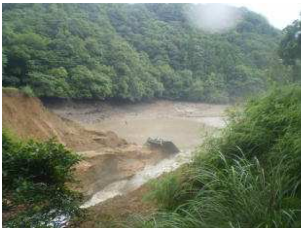
足河内下ため池決壊状況（下関市豊田町）

また、河川の氾濫等により水稻や大豆、野菜等が冠水し、被害面積は238.1haに上りました。