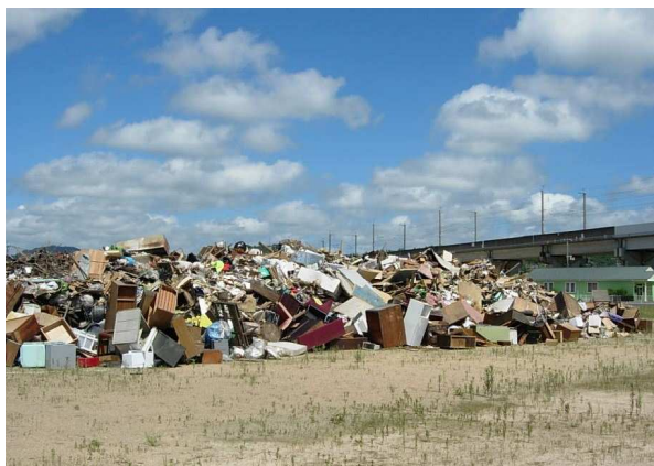
集積された災害廃棄物（山陽小野田市）