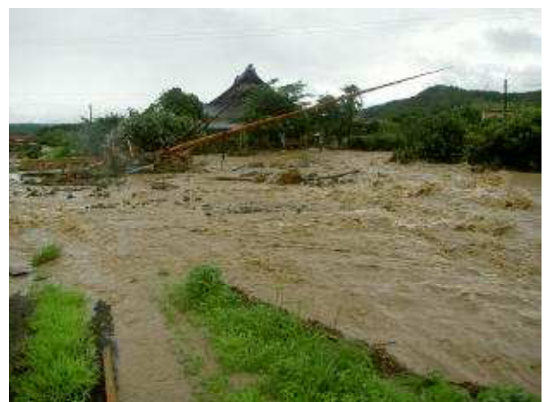
高山川の氾濫状況（下関市豊田町大字高山）