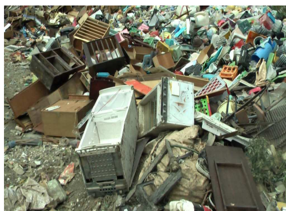
集積された災害廃棄物（美祢市）