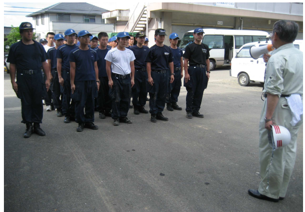
警察学校学生ボランティア（山陽小野田市）