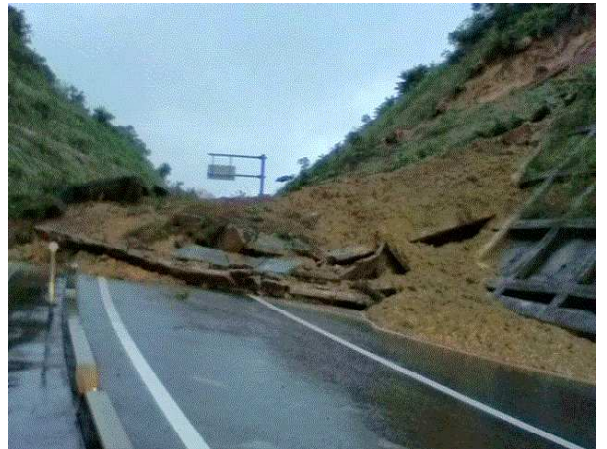
県道萩三隅線の被災状況（萩市三見）