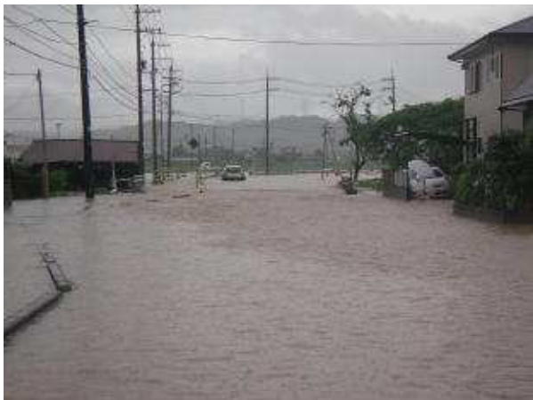
県道下関長門線の状況（下関市豊田町）