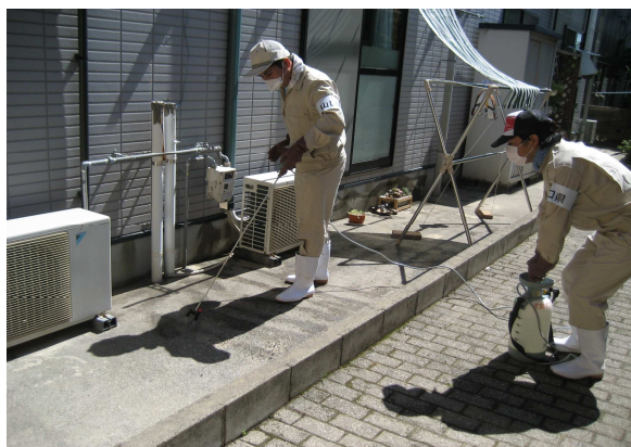
消毒活動の状況（山陽小野田市）

また、山陽小野田市では、7月17日から19日にかけて1,900袋（9.5t）の消石灰を配布しました。