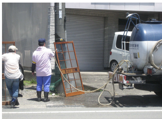
「洗い水」の給水活動(山陽小野田市)

さらに、山陽小野田市においては、浸水被害にあった家具や調度品などの洗浄に使用する「洗い水」を提供するため、17日、18日に道路散水車や消防車両等による給水活動を実施しました。