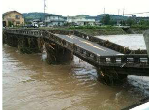
新橋に添架された水道管の破断状況 (山陽小野田市鴨庄)