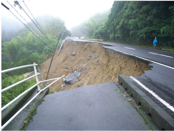
国道489号の被災状況（周南市小畑）

県管理道路では、国道262号（防府市勝坂地区）が事前通行規制により、国道489号（周南市小畑地区）が法面崩壊により全面通行止めになるなど、最大で112箇所において全面通行止や片側交互通行などの通行規制が行われました。