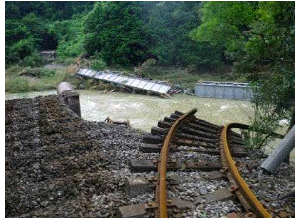
JR美祢線 第3厚狭川橋りょう流出の状況（美祢市西厚保）