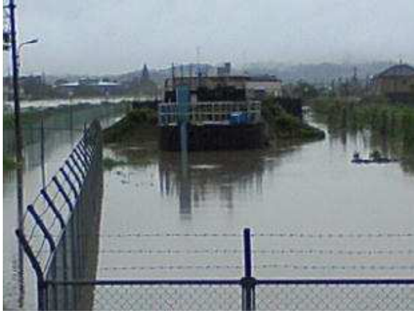
鴨庄浄水場浸水状況 (山陽小野田市鴨庄)