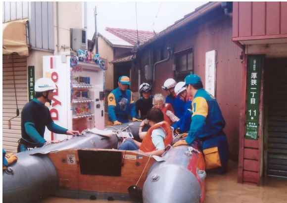
警察によるゴムボートを使用した救出救助活動 (山陽小野田市)