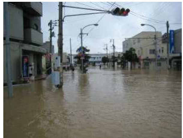
厚狭駅前交差点（山陽小野田市厚狭）