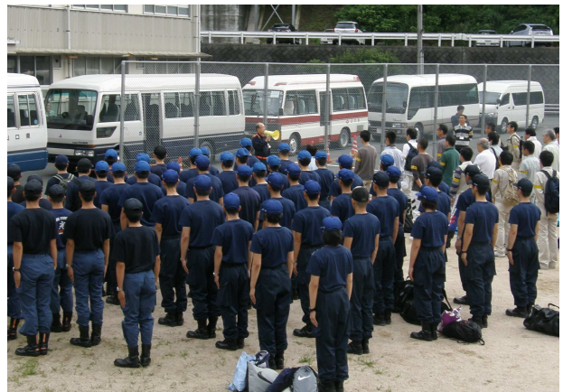
県職員ボランティア出発式（県庁）