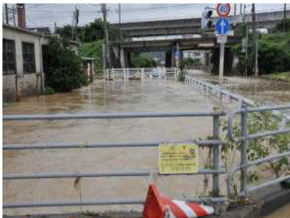
桜川の氾濫状況（山陽小野田市山川）