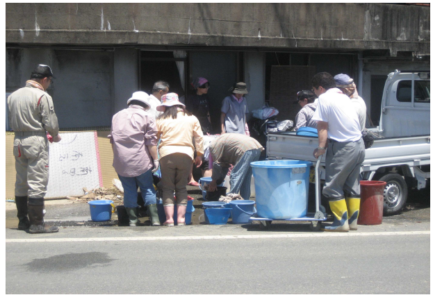
作業を行うボランティア（山陽小野田市）