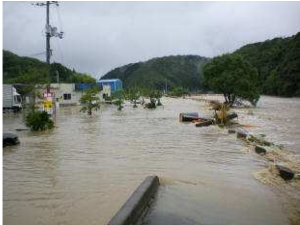
厚狭川の氾濫状況（山陽小野田市厚狭松ヶ瀬）

7月10日からの断続的な大雨に加え、15日の県西部地域、特に、下関市、美祢市を中心に時間雨量が50mmを越す局地的な集中豪雨に見舞われたため、下関市、美祢市、山陽小野田市では、木屋川・厚狭川水系で河川氾濫が発生し、居住地域に大規模な浸水被害が発生しました。