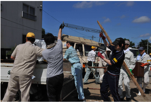
作業を行うボランティア（山陽小野田市）