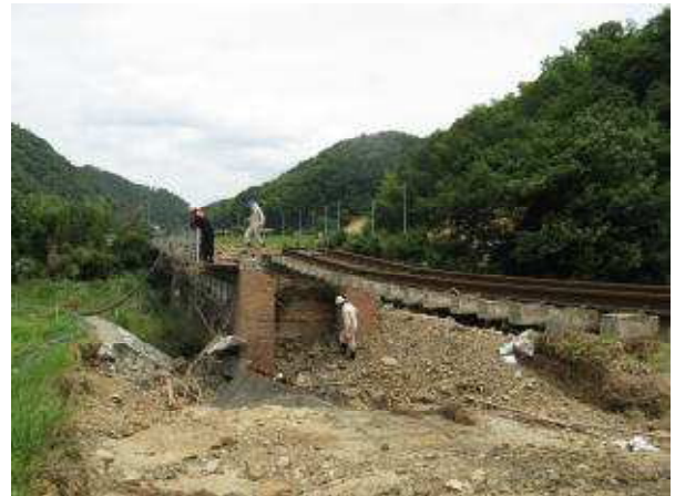
JR美祢線 第7厚狭川橋りょう盛土流出の状況（美祢市大嶺町）