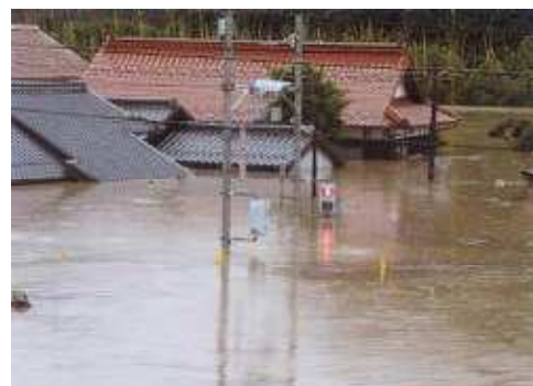
家屋の浸水状況（美祢市西厚保）