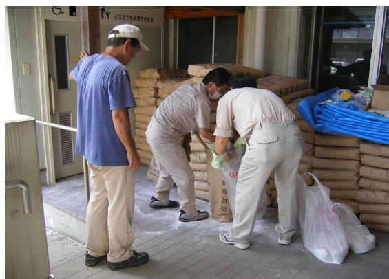
消石灰配布の状況（山陽小野田市）