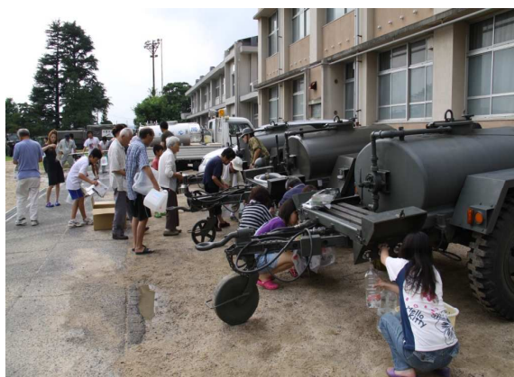
自衛隊による給水支援活動(山陽小野田市)