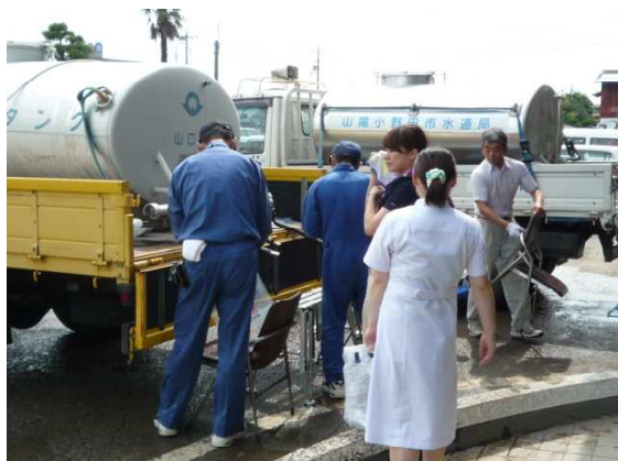
山陽総合事務所での給水支援活動

さらに、山陽小野田市においては、浸水被害にあった家具や調度品などの洗浄に使用する「洗い水」を提供するため、17日、18日に道路散水車や消防車両等による給水活動を実施しました。