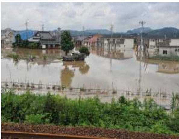
家屋の浸水状況（山陽小野田市厚狭）