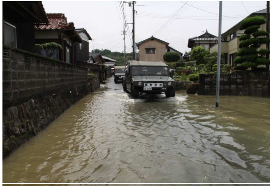
救出救助活動に向かう自衛隊 (山陽小野田市)