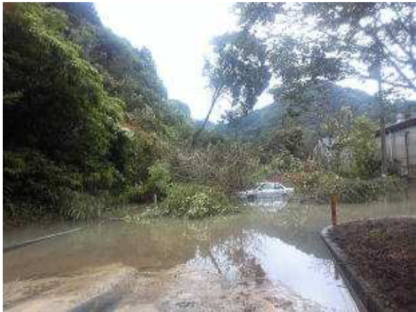
国道491号の被災状況（下関市菊川町）