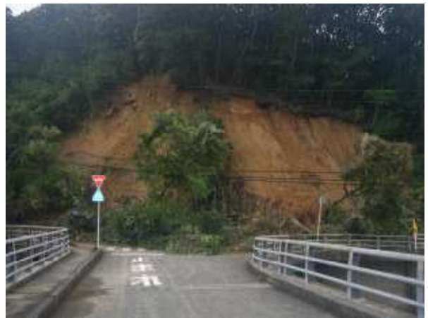
県道下関美祢線の状況（美祢市西厚保）