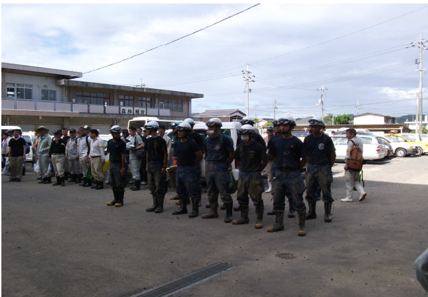
消防学校学生ボランティア（山陽小野田市）