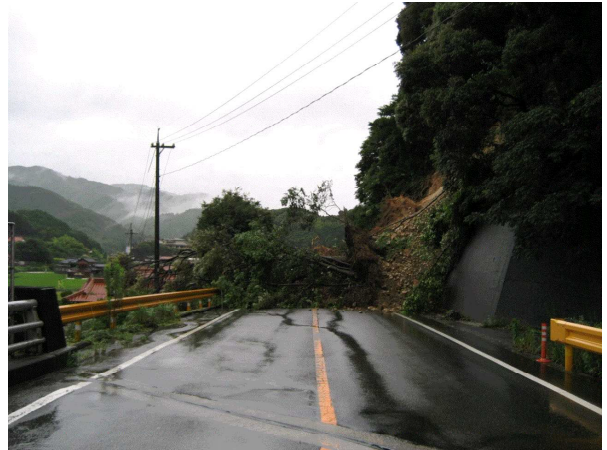
国道316号の被災状況（長門市四ノ瀬）