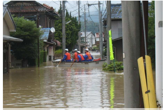
消防によるボートを使用した救出救助活動 (山陽小野田市)