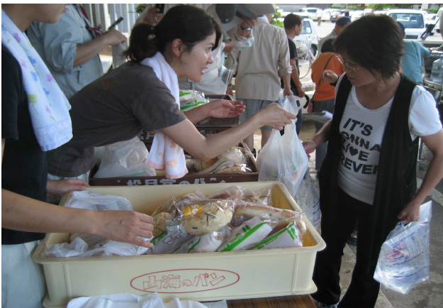
物資の提供を行うボランティア（山陽小野田市）