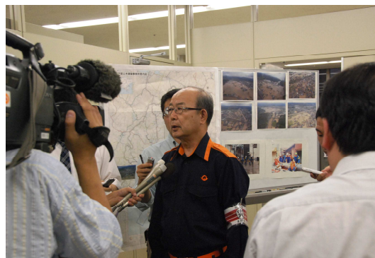
記者会見を行う二井知事