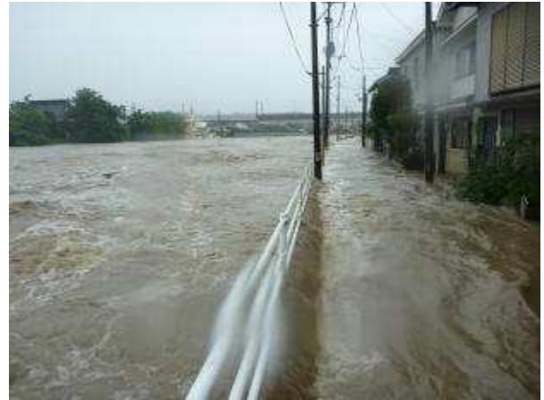
厚狭川の氾濫状況（山陽小野田市厚狭鴨橋周辺）