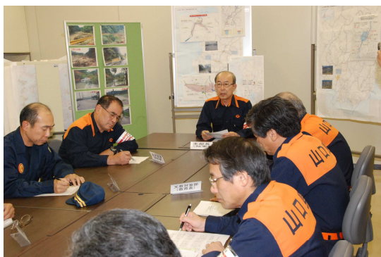
山口県災害対策本部員会議の様子

さらに、7月15日10時30分には、下関災害対策地方本部及び宇部災害対策地方本部を設置し、被災市、消防や自衛隊等現地派遣部隊との連絡調整など、被災現地における災害応急対策業務にあたりました。