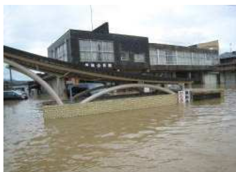
厚狭公民館（山陽小野田市厚狭）

特に、甚大な被害が発生した山陽小野田市には、災害救助法の適用と併せ、被災者生活再建支援法を適用し、美祢市には、被災者生活再建支援法を適用しました。