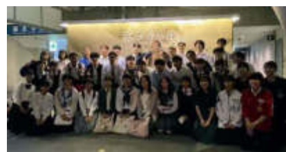
薩長土肥4県の高校生による学び