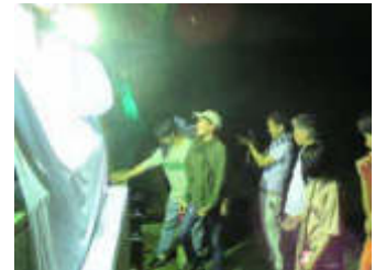
身近なものから学ぶプログラム

障害など困難を抱える子どもたちが、課題解決に向けてチャレンジしていくために必要な考え方や手法などを学ぶワークショップの開催