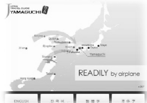
多言語ウェブサイト