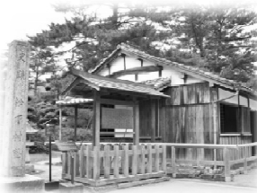
松下村塾 (世界文化遺産登録を目指す)