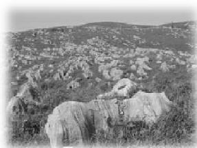
秋吉台 (ジオパーク認定を目指す)