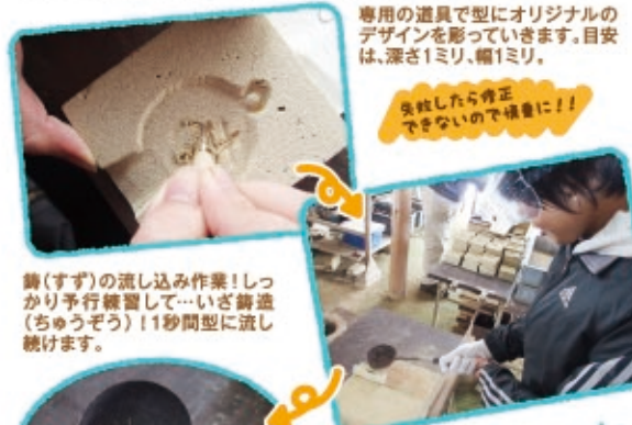
専用の道具で型にオリジナルのデザインを彫っていきます。目安は、深さ1ミリ、幅1ミリ。 失敗したら修正できないので慎重に!!