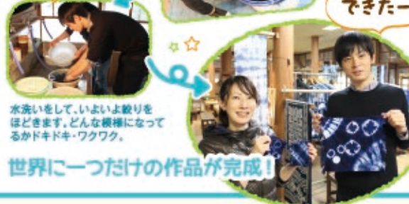
水洗いをして、いよいよ絞りをほくくします。どんな模様になるかドキドキ・ワクワク。