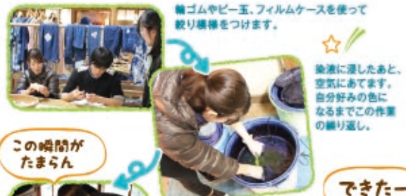
輪ゴムやビー玉、フィルムケースを使って絞りを繰り返します。

昭和初期の山村風景の中で、古くから伝わる日本の伝統工芸づくりに挑戦!現代版ではあるものの、本物の染料で作ることができる藍染め。何度やっても絞りをほくく瞬間は感動ものです。