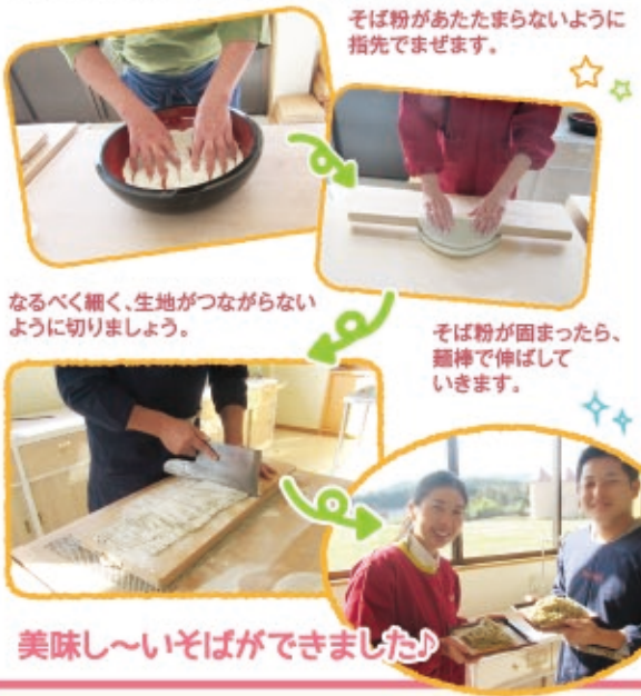
そば粉があたまらないように指先でまぜます。