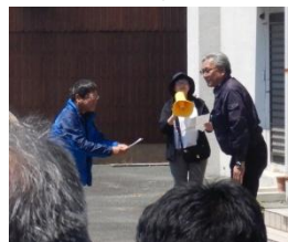
榎野川漁業協同組合様