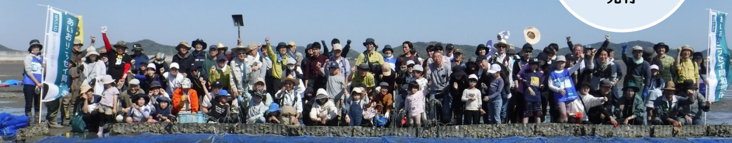
2025年4月26日 榎野川河口干潟再生活動 集合写真