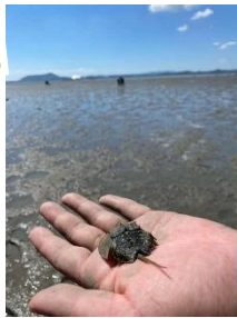
長浜・南潟のカブトガニ調査結果 <発見個体数>