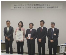
あいおいニッセイ同和損害保険(株)様