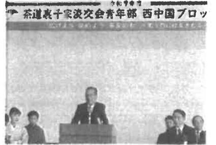
2025年10月26日 茶道裏千家淡交会で挨拶 茶道裏千家淡交会青年部西中国ブロック研修会が 宇部市ときわ湖水ホールで開催されました。淡交会 宇部支部長として歓迎のご挨拶を申し上げます。