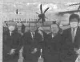
1月29日：与那国駐屯地を視察 与那国駐屯地を視察、台湾が目の前の先にあり台湾海峡の緊張をひしひしと感じました。