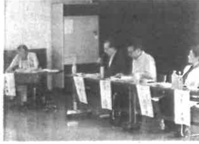
2025年8月5日 厚南4地区連絡協議会との懇談会 厚南4地区連絡協議会と地元県議会・市議会議員 との懇談会が開催され、同地区が抱える安全安心 づくりや交通渋滞の解消などについて協議しました。