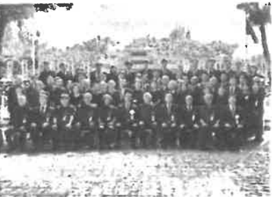
2025年11月5日 「防長英霊の塔」慰霊祭 山口県南方地域戦没者「防長英霊の塔」慰霊祭 に自民党山口県連県議団の一員として出席しま した。