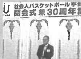
3月1日：宇部リーグ創立30周年式典 社会人バスケットボール宇部リーグ創立30周年記念式典を宇部ホテル宇部で開催。これからも盛り上げてまいります。