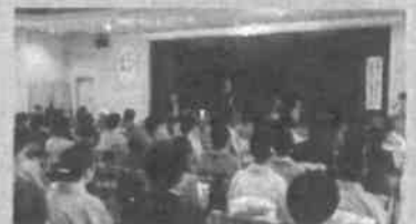
3月16日：茶道真千家決交会宇部支部 茶道真千家決交会宇部支部・青年部の総会が宇部市男女共同参画センターで開催。引き続き令和7年8年度支部長を務めることになりました。