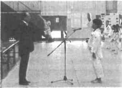
2025年9月7日 宇部近郷柔道大会・県選抜少年柔道大会 第74回宇部近郷柔道大会並びに第22回山口県選 抜少年柔道大会が宇部市武道館で開催、県内各地 より48団体が参加し、熱戦が繰り広げられました。