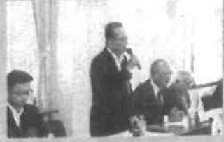
5月26日：山口県砕石協会総会 砕石は、道路などのインフラ構築に不可欠な資材。危険を顧みずご尽力頂いている皆様に感謝申し上げます。