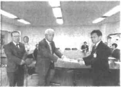
2025年11月17日 河川改修事業の促進を要望 宇部市の中川広域灌漑河川改修事業の促進について 山口県土木建築部千石部長に要望。現在は第2期区間 の工事が進められており、早期実現について要望しました。