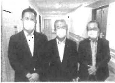
2025年7月29日 環境福祉委員会の県内視察 環境福祉委員会の県内視察。周南保健所では、野 犬対策に関する取組、鼓ヶ浦整肢学園では、障害 のある子どもへの医療について調査しました。