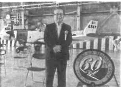
2025年10月18日 小月教育航空群隊60周年記念 小月教育航空群隊60周年記念行事が海上自衛 隊小月航空基地で行なわれました。日本の独立と 平和を守る為ご尽力頂きます様お慶い申し上げます。