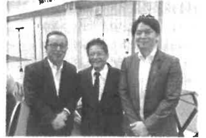
2025年10月1日 山口県私学振興議員連盟定例会 山口県私学振興議員連盟定例会議が山口市のセント コアで開催。それぞれの建学の精神に則った特色 ある教育の実現を、しっかり支援して参ります。