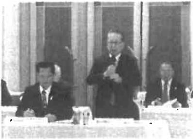
2025年10月22日 自民党山口県連政策聴聞会 自民党山口県連政策聴聞会が山口市のセントコア で開催されました。医療・福祉、環境生活関係12 団体から多岐にわたるご要望をお聴きしました。