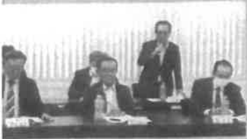
5月21日：宇部小野田清港会通常総会 48年の長きにわたり、宇部港・小野田港の清浄活動に取り組んでおられます。船舶が安全安心に航行できるのもこうした皆様のおかげです。