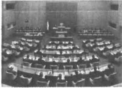
2025年9月13日 山口県議会9月定例会 山口県議会9月定例会が開会。補正予算案など17 の議案が提出され、宇部市や下関市で被害が被災 した災害復旧事業など、しっかり審議して参ります。