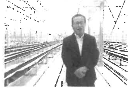
2025年8月28日 農林水産委員会の視察 県議会農林水産委員会の視察で宇部市のビバ ファームを視察。ICTを活用した太陽光利用型植物 工場でトマトを栽培されています。