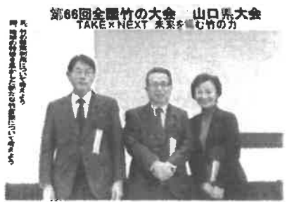
2025年11月21日 農林水産委員会の視察 第66回全国竹の大会山口県大会が宇部市ときわ 湖水ホールで開催。山口県は全国第4位の竹林面 積があり、利活用すれば有効な資源となります。