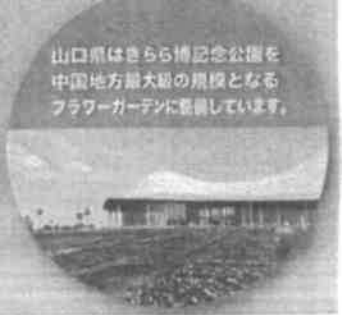
山口県はさらに博記念公園を中国地方最大級の規模となるフラワーガーデンに整備しています。