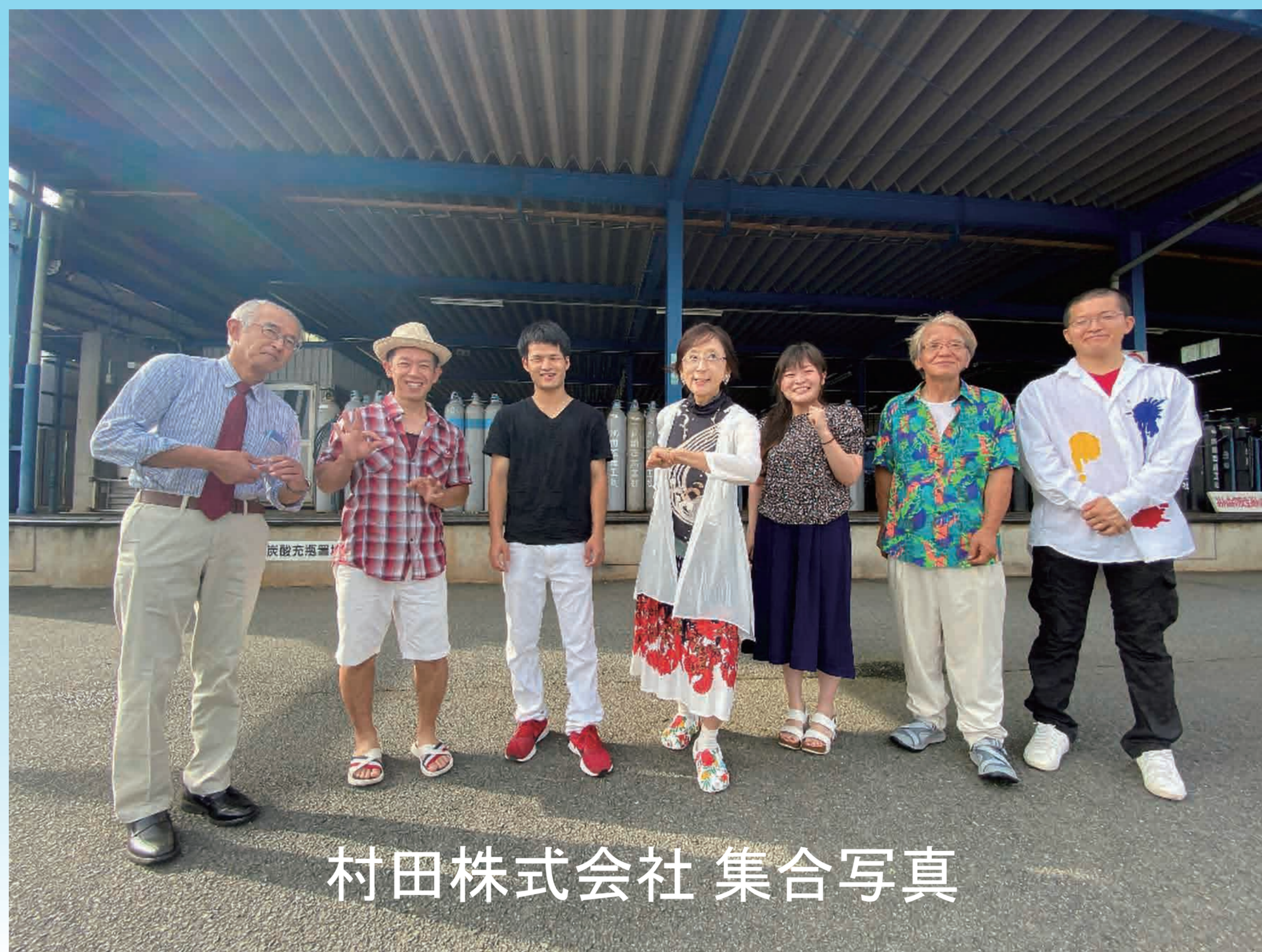
村田株式会社 集合写真