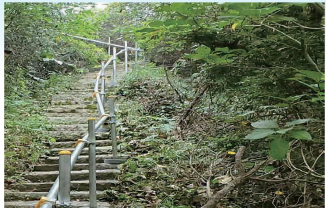
野島島内石段への手すりの寄贈