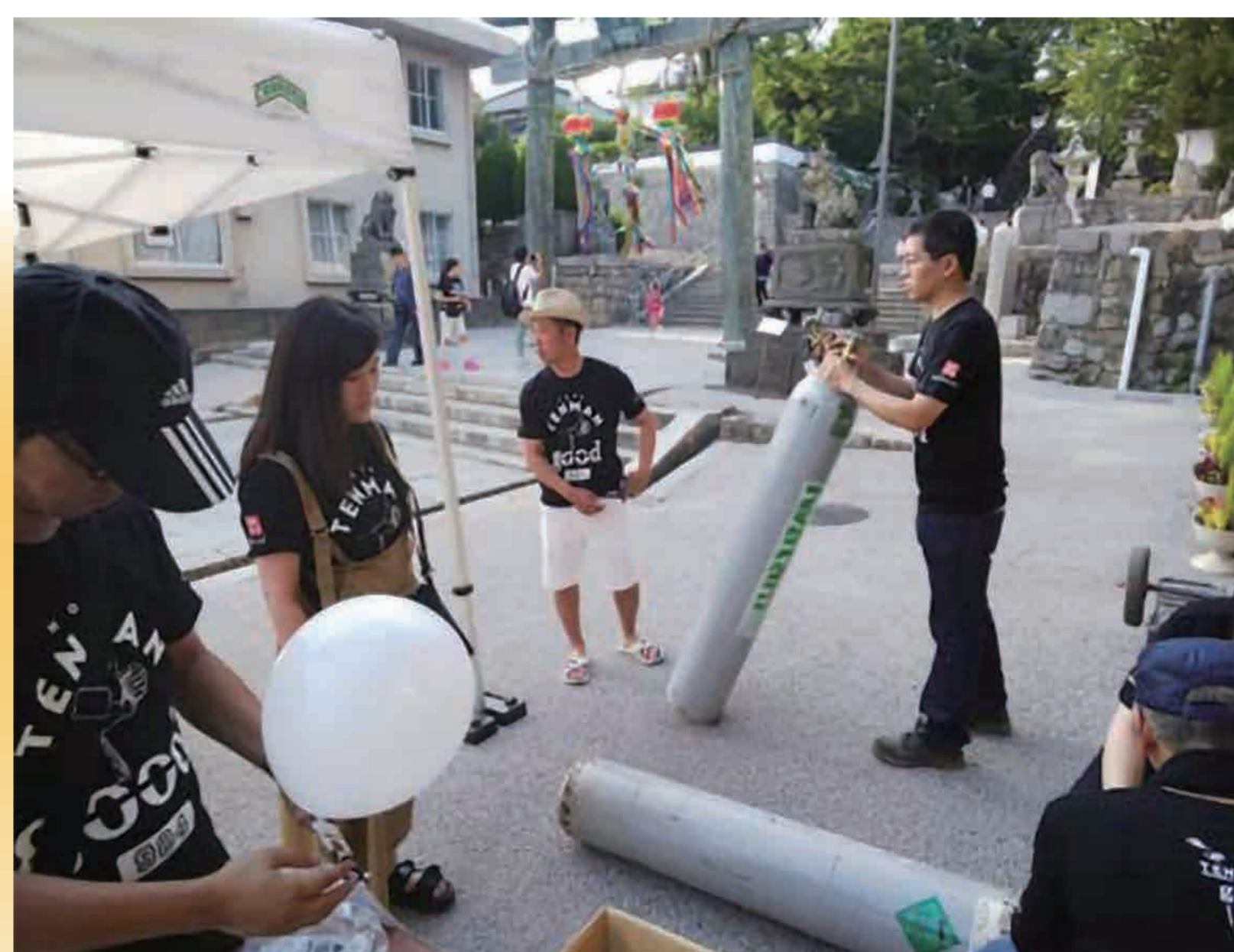
防府天満宮 七夕イベント参加