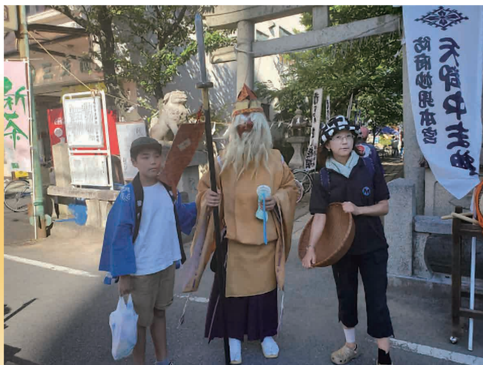
車塚妙見神社の 秋の大祭のお手伝い