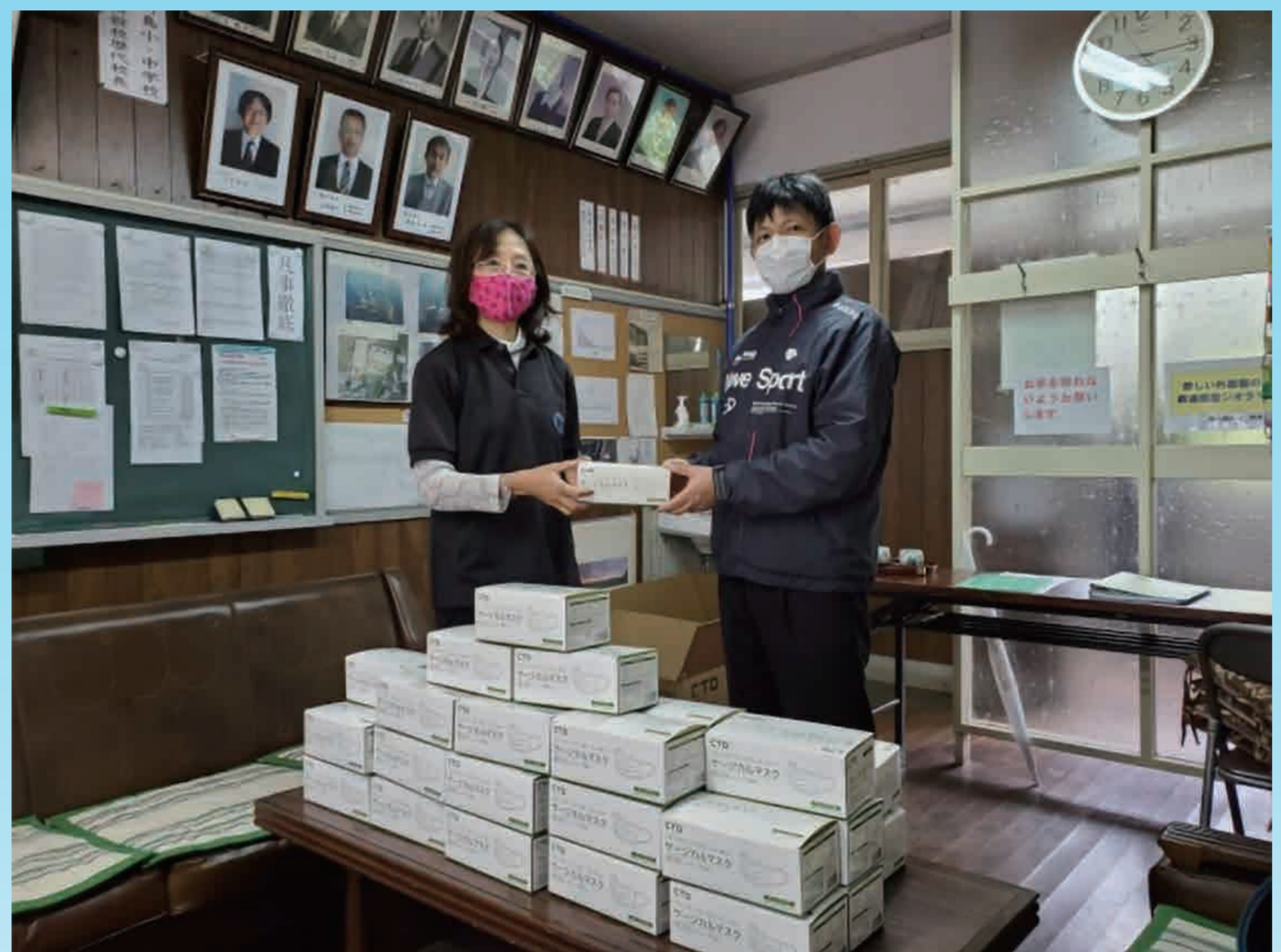
防府市立野島小・中学校 へのマスク寄贈