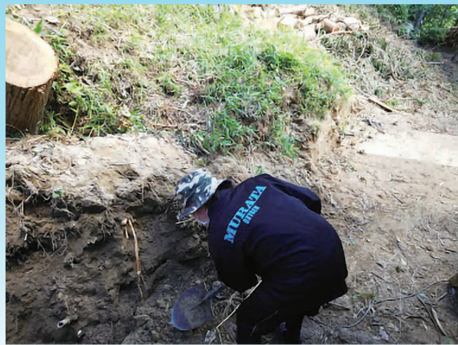
平成30年7月豪雨の 災害ボランティア活動