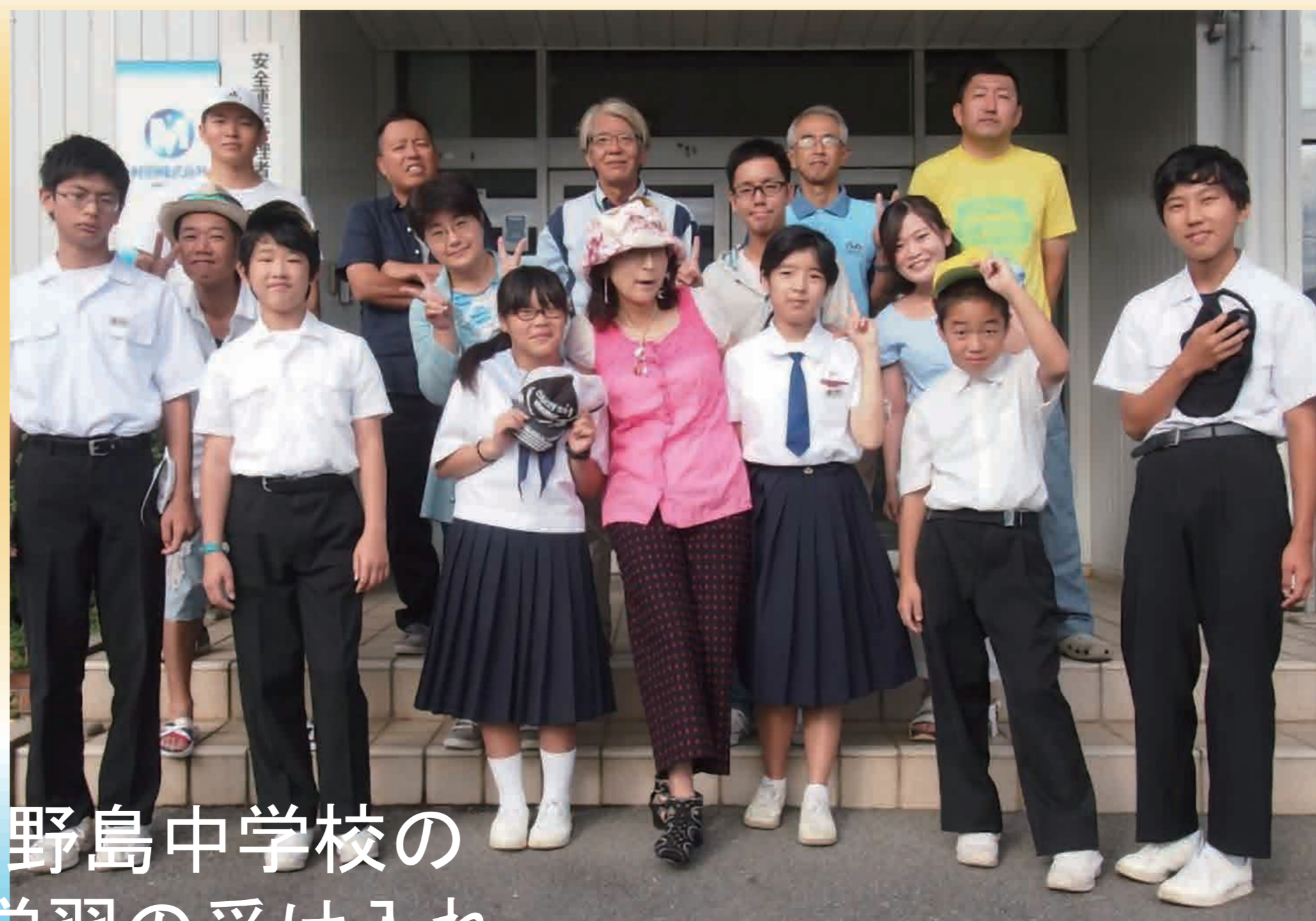
防府市立野島中学校の 職場体験学習の受け入れ