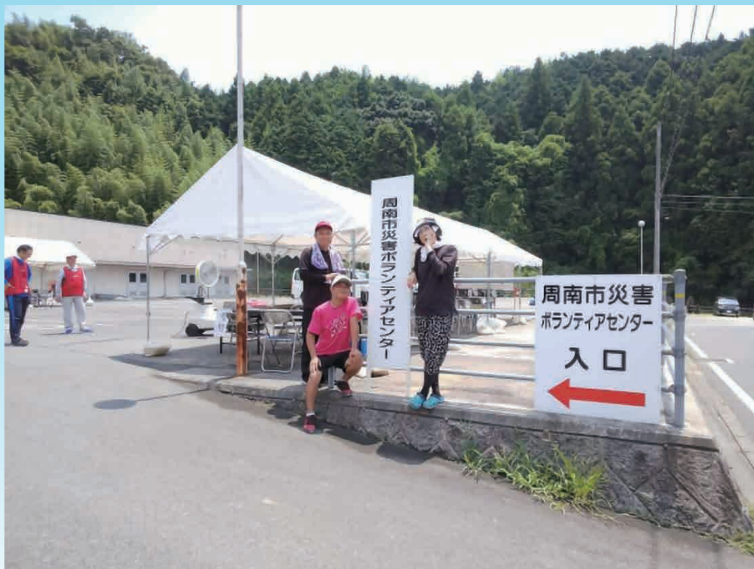
豪雨災害ボランティア センターにて