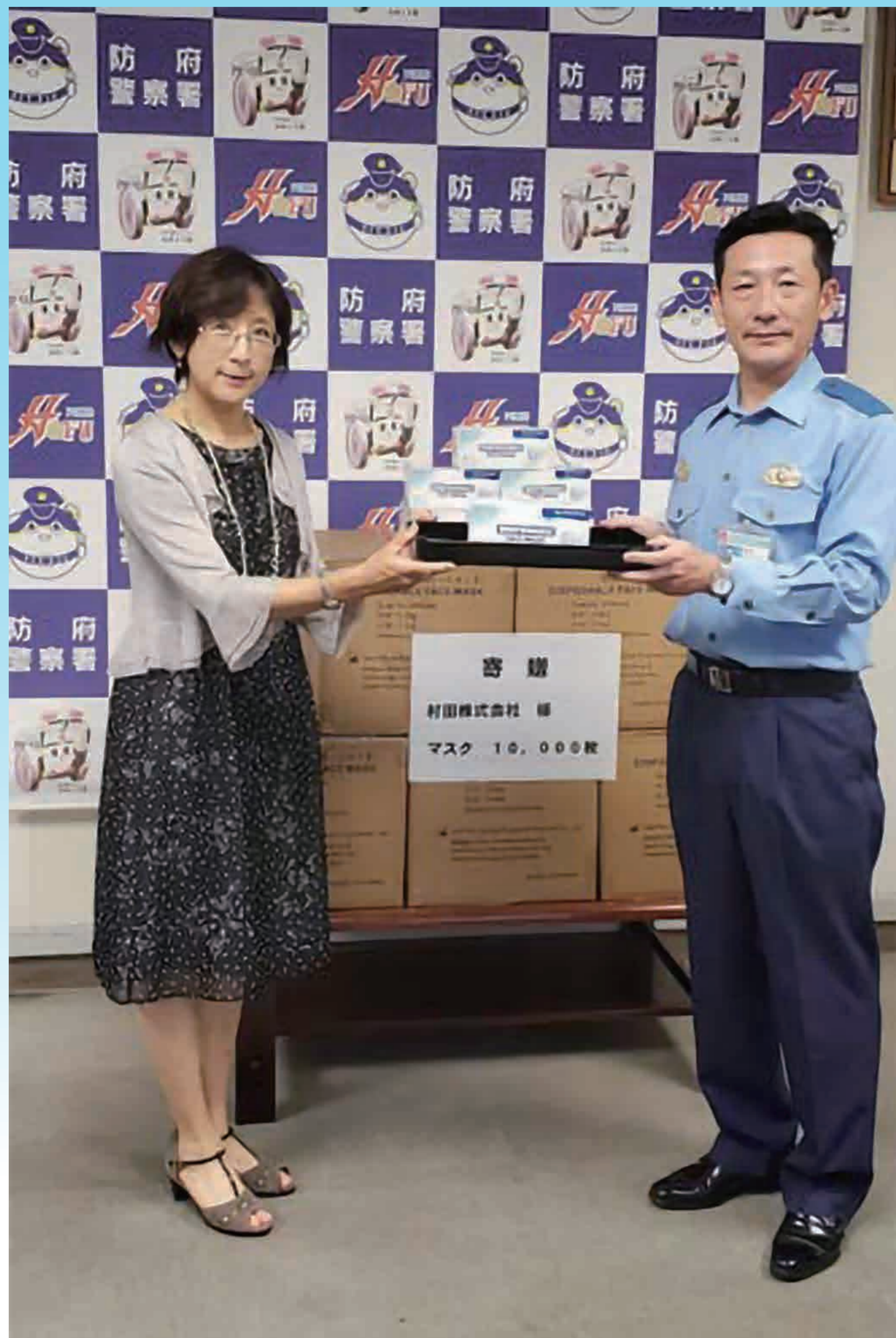
防府警察署へのマスク寄贈