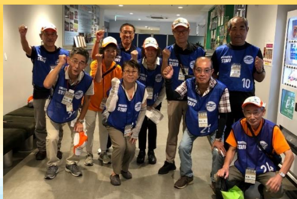
2013年の東京国体を契機に現在も活躍する まちだサポーターズ(まちサポ)の面々