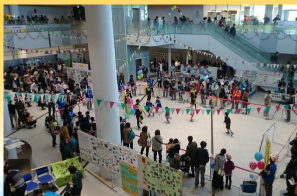
町田市市民協働フェスティバル まちカフェの様子