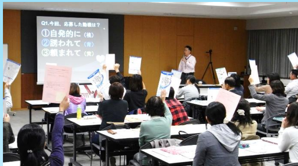
県内全市町で合計100回実施した ボランティア基礎研修会