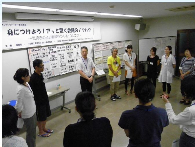
ファシリテーター養成講座の様子