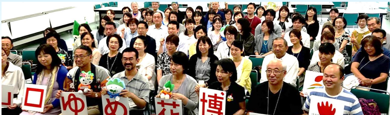
ゆめアクション申込者のつどいの様子