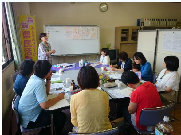
自主事業たねカフェの様子