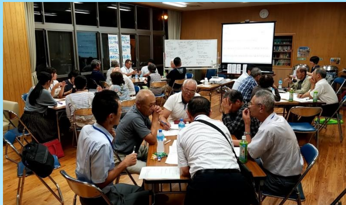
夢プランづくりワークショップの様子(柳井市)