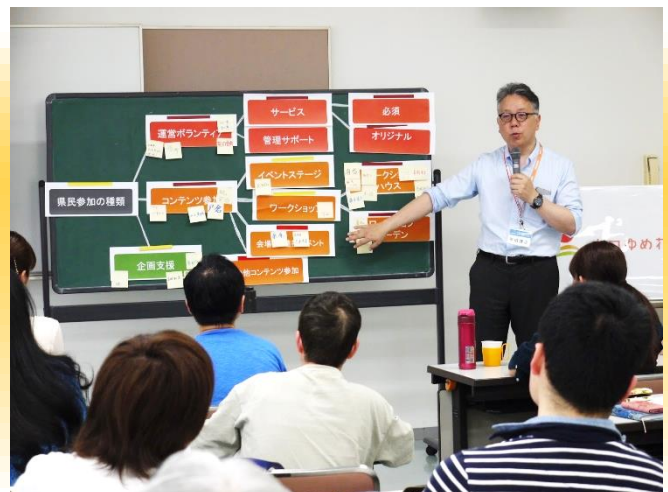
山口ゆめ花博 県民ゆめ花チャレンジ コアメンバー会議風景