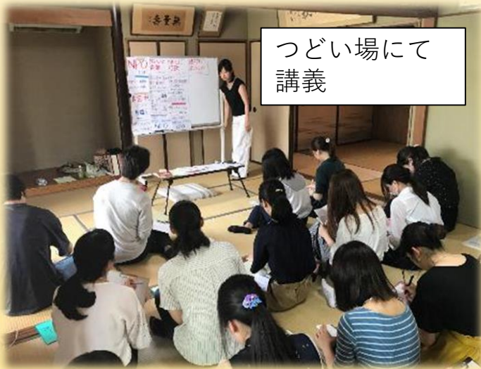
つどい場にて 講義

6月から毎週月曜午後から授業に スタッフも参加 グリーフを学び 当事者の生の声も聴きます。