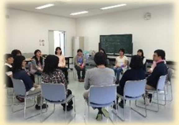
2016.5 初回養成講座の様子

病気・事件・事故・などにより大切な人、大切な何かを失った体験からくる悲しみや苦しさ、怒り、無気力感など誰もが抱えるグリーフ（様々な感情）を身近で支え合えればと、「グリーフサポートやまぐち」は、『子どもとおとなのつどいの場』として活動しています。