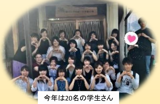
今年は20名の学生さん

この日は山口市さぼらんてスタッフ講師です。 防府市の市民活動支援センターさんも参加。 サポートには様々な視点が必要です。