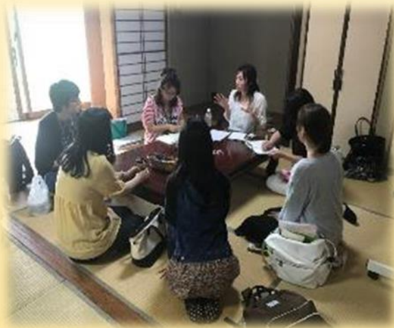
「子ども・大人のつどい」前の スタッフミーティング

子ども・大人のつどい(毎月第2日曜日 13:00~15:30 開催) 当事者の生活支援(関係機関の紹介、裁判支援等)