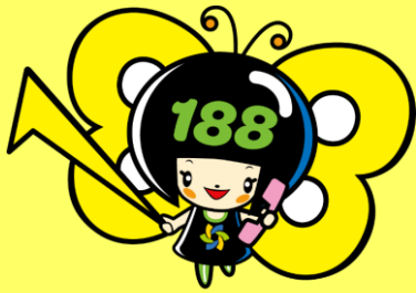
消費者庁 消費者ホットライン188 イメージキャラクター イヤヤン

さらに今年度から、消費者ホットラインをもっと知ってもらうため、消費者月間の「5」月と188の頭2桁の「18」を合わせた「 5月18日 」を「消費者ホットライン188の日」と制定しました。