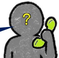
「ハウスメーカー」の ワダを名乗る男