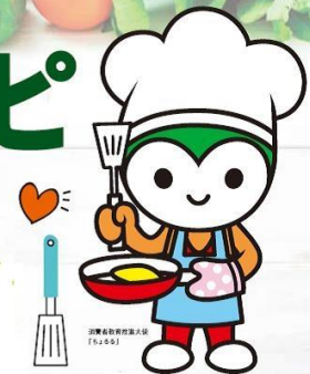
消費者教育推進大使ちよるる