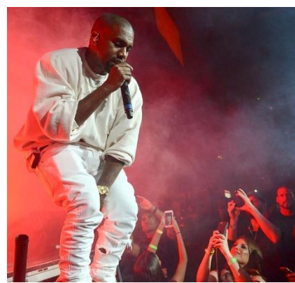
カニエ・ウェスト

日本と違いアメリカでは「おめでとう！これで成人だね！」と言われる年が 3 回あります。一回目は 16 歳、二回目は 18 歳、三回目は 21 歳。なぜ三回あるかというと、そ