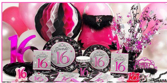
Party City のデコレーション

私のスイート16はささやかに家で祝いました。アメリカには Party City という店があり、風船、カトラリー、あらゆるパーティー用のデコレーションを販売しています。もちろん、スイート16をテーマにしたデコレーションを販売しているので、私の家族はそこで調達しました。当日フォトブースとディスコボールを設置し、来てくれた友達と踊り、ケーキやフィンガーフードを食べお祝いしました。家で開催しましたが、みんなかわいいドレスを着て、ティアラを着け楽しみました。