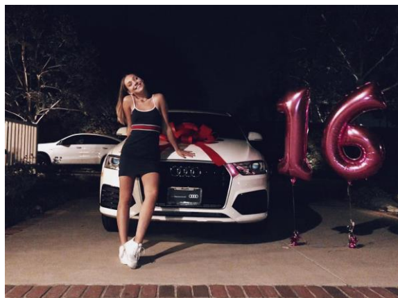
スイート16に車のプレゼント

の年から始まるマイルストーンがあるからです。18歳では選挙権を与えられ、21歳ではお酒を飲み始められます。16歳では運転免許を取れるようになることから子供に車をプレゼントする親は少なくはありません。なので、この三つの歳に大きな誕生日会をすることはよくありますが、一般的に一番力が入るのが16歳、スイート16の時です。