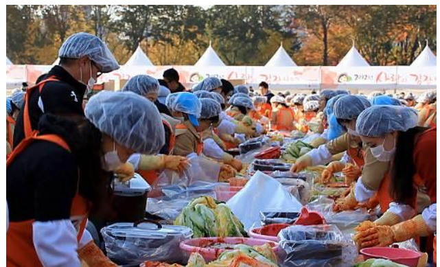
↑イベントでの「キムジャン」の姿