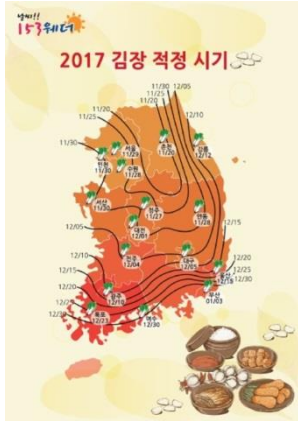
↑ 2017 년 김장 적정 시기

두 번째로는 ‘김치냉장고’ 입니다. 김치를 더 맛있게 보존하기 위해 만들어졌습니다. 물론 김치 이외의 식재료도 보관할 수 있습니다. 모든 가정이 다 김치냉장고를 가지고 있는 것은 아니지만 한국인이란 다들 김치 냉장고를 알고 있습니다.