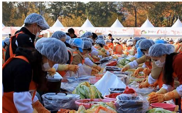
↑ 김장 이벤트 모습

한국에서는 김장과 관련하여, 다른 나라에는 없는 것이 2가지 있습니다. 첫 번째로는 ‘김장 적정 시기 지도’ 입니다.