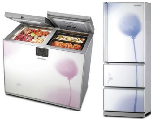
↑ 김치 냉장고

‘김장’ 은 지역과 세대를 초월해 광범위하게 전승되고 있습니다. 또한, 이웃과 나눔의 정을 실천하고 국내의 다양한 공동체 간의 대화를 촉진해 결속을 다지게 하여, 한국인들에게 정체성과 소속감을 줍니다.