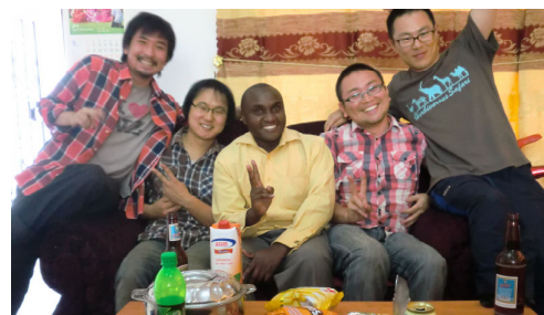
韓国のボランティア KOICA

5回にわたってお届けしてきた活動レポートですが、いかがだったでしょうか? 日本の皆様に少しでもタンザニアの魅力、協力隊の魅力をお伝えすることができたのであれば本望です。辛いこともたくさんありましたが、嬉しいことや楽しいこともたくさんあった2年間でした。帰国後はタンザニアで得た経験を日本社会に少しでも役立てることができるように努めていきたいと思っています。ではでは、またどこかでお会いしましょう。