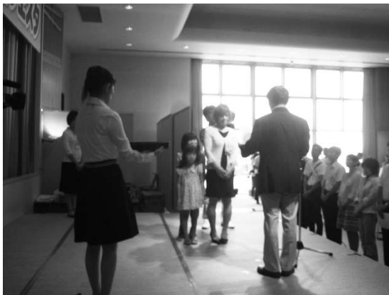
【きらめき子育て賞の表彰】

また、このフェスタに合わせ、1日、2日の両日、県内235箇所の保育所、幼稚園、児童館、地域子育て支援センターなどにおいて、自主イベントや園庭開放が実施された。