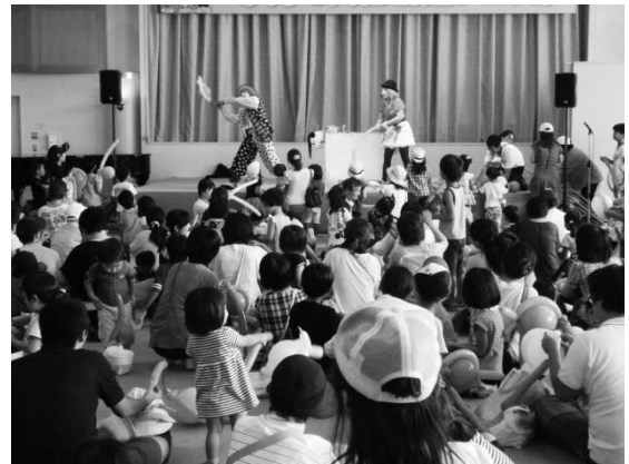
【ピエロのバルーンアート教室】