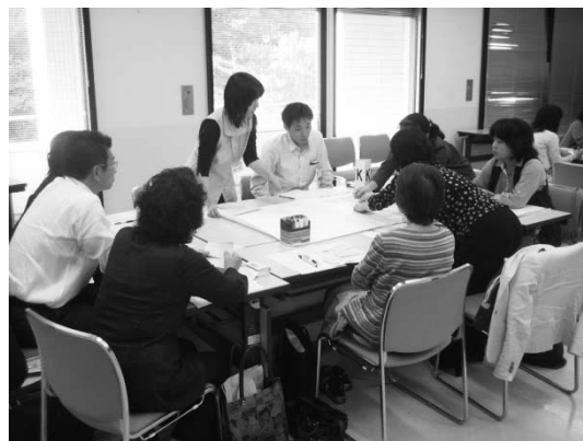
[グループ討議の様子]